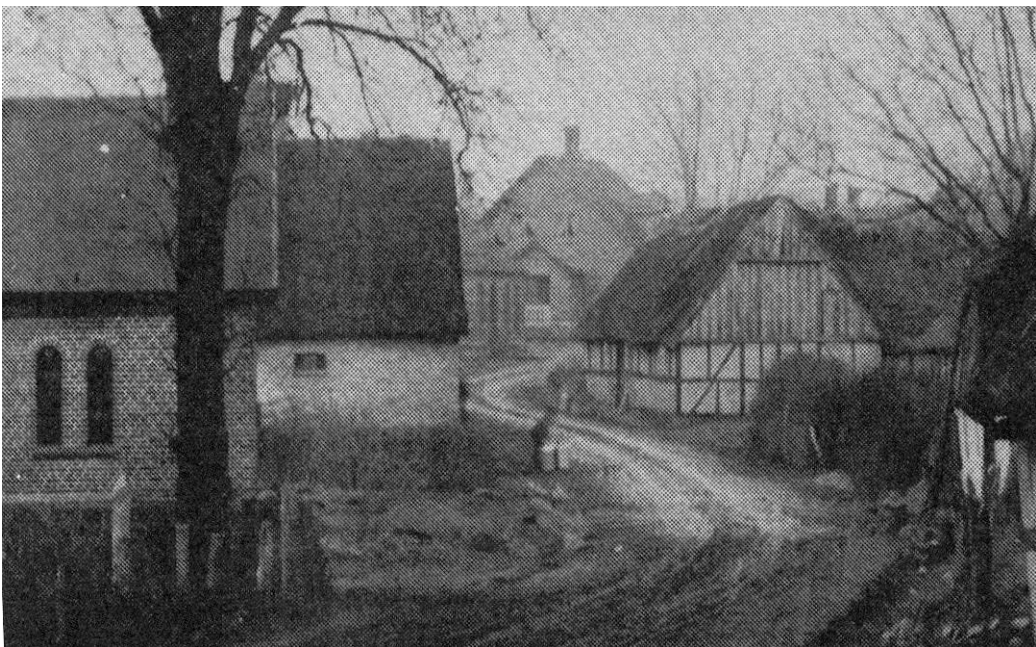
Chr. Jacobsens gård lå lige over for præstegården. Billede fra omkring år 1900. Forsamlingshus og præstegård til venstre.