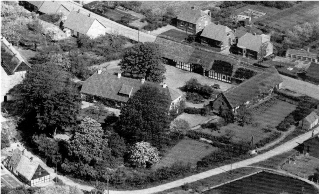
Præstegården med omgivelser 1947.