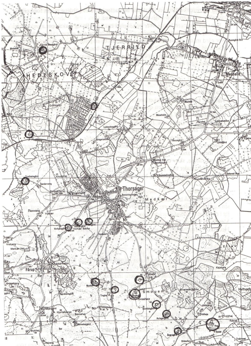
Udflyttergårdene fra Thorsager er på dette kort markeret med en ring omkring. De tre gårde udflyttet efter 1793 er Vorbjerggård, Vorkærgård og Dalgård.