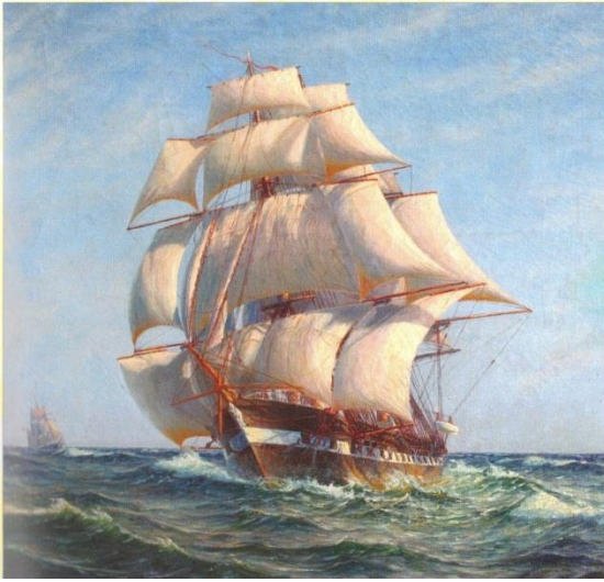
Fregatten i sine velmagtsdage, flådens hurtigste

Fregatten ”Jylland” udgik af flåden i 1908 for at blive hugget op. Men private indsamlinger forhindrede ophugningen, og skibet fandt i de følgende år andre anvendelser, bl.a. var det i mange år logiskib for skolebørn fra provinsen i Københavns havn.