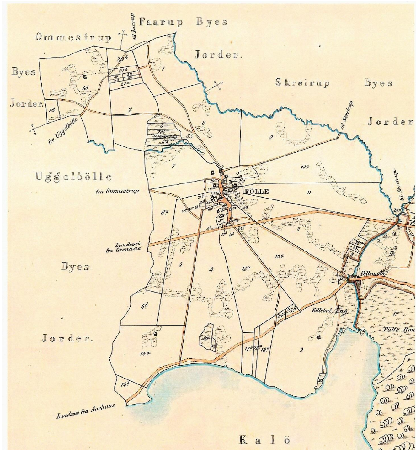
Kort over Følle ejerlav, ca. 1836, senere optegnet (f.eks. er den nye Århus-Grenaa-landevej fra 1855 indsat).

(nordøst for Korslund-krydset). Hus nr. 23 fik en meget smal strimmel jord mellem de to tidligere omtalte lodder til nr. 17 og 18, mens nr. 24 og 25 fik en mindre lod nordøst for lodden til nr. 18.