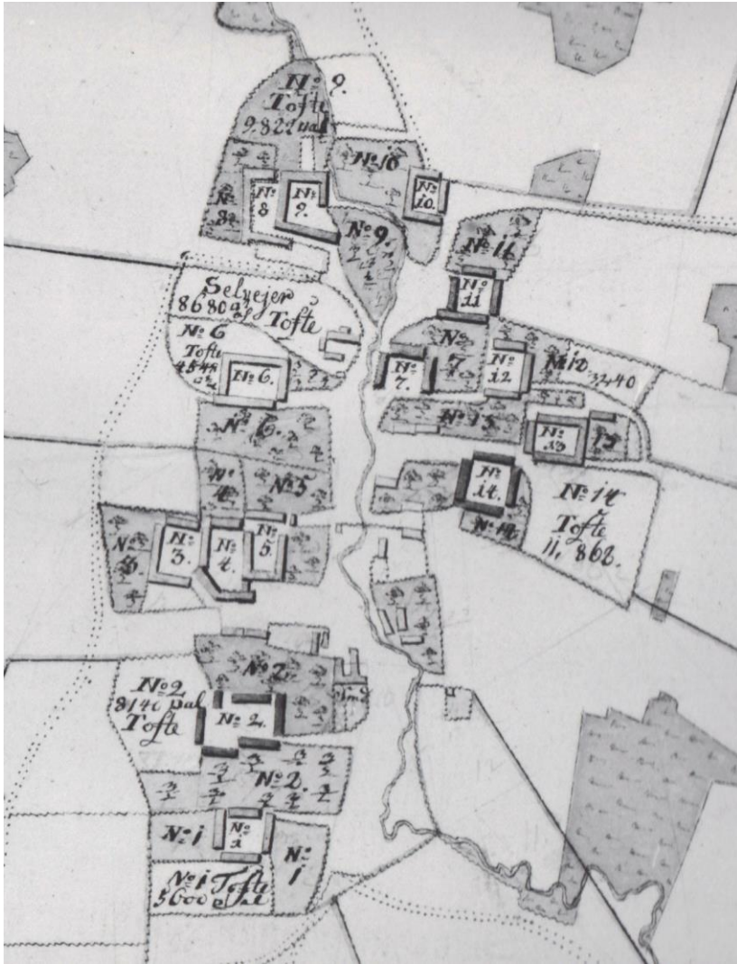
Gårdene i Følle landsby ved udskiftningen i 1782, udsnit af udskiftningskortet. Gårdenes numre på udskiftningskortet svarer ikke til de senere tildelte matrikelnumre, jf. matrikelkortet fra 1836 (se senere).

På tidspunktet for udskiftningen bestod Følle ligesom i 1688 af 14 gårde. Tre af disse hørte under Vosnæsgård og andre tre under Hospitalet i Århus 6 .