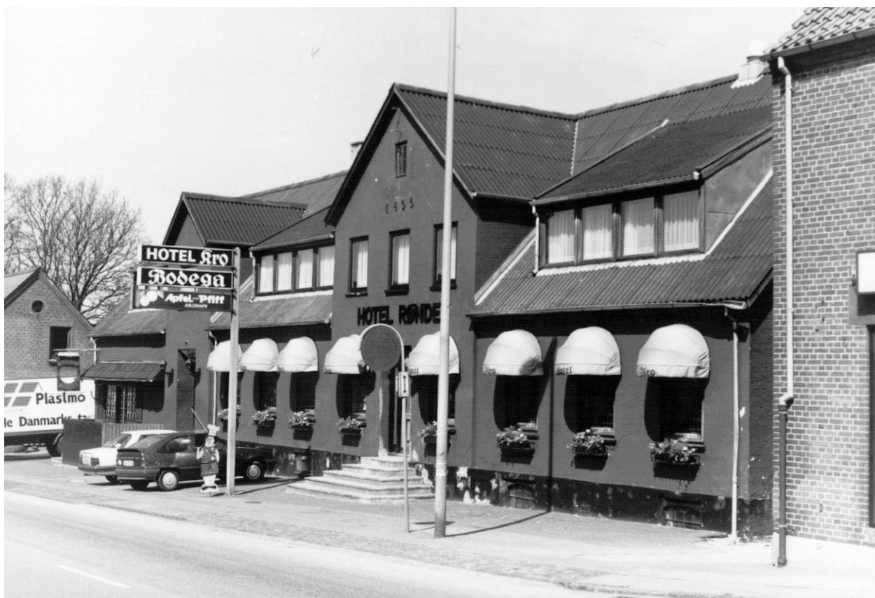
Hotel Rønne 1987 - mellembygningen er nu bodega ("Kringlen"). Hotellet er malet okserødt.