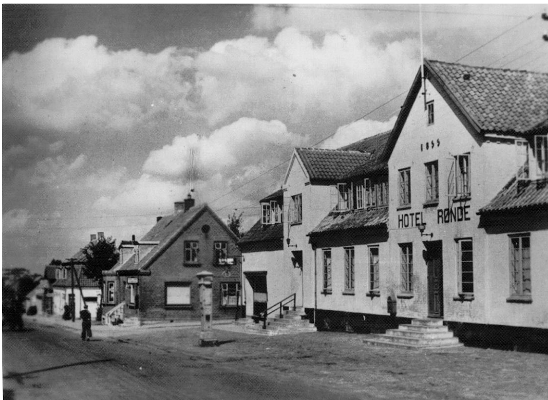
Hotel Rønne omkring 1937. Der er nu bageri i mellembygningen, og der sælges benzin fra en stander ude ved vejen. Den store træbalkon på hovedbygningen er væk.