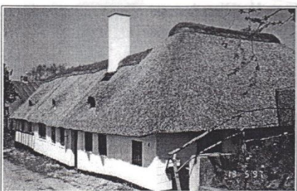
Østervej 4, opført i 1700-tallet og 1978