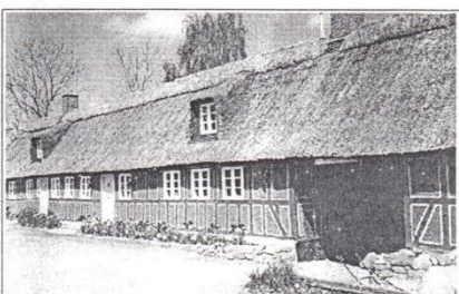
Krogryggevej 2, opført ca. 1827

40 Bevaringsværdige huse i Kejlstrup, ifølge lokalplanen. Ud over de viste er også stuehuset til Stenbjergvej 11 erklæret bevaringsværdig.