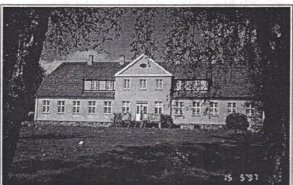
Kejlstrupvej 29, opført 1919