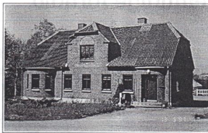
Stenbjergvej 4, opført 1919