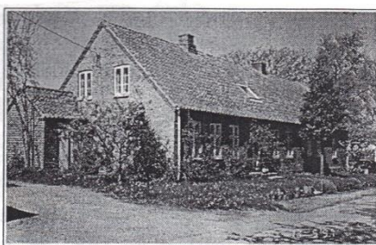
Kærtoften 2, opført 1890