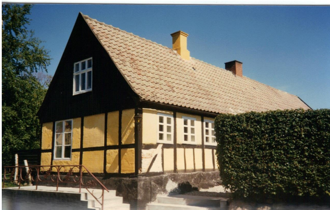
Købmandsgården fotograferet 1997. Den gamle købmandstrappe er endnu intakt.VFH.

Der var jord omkring huset, da det var beboet, men det er inddraget i gårdens almindelige drift.