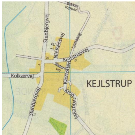
Kejlstrup, kort med gadenavne. Fra vejviseren 2013.