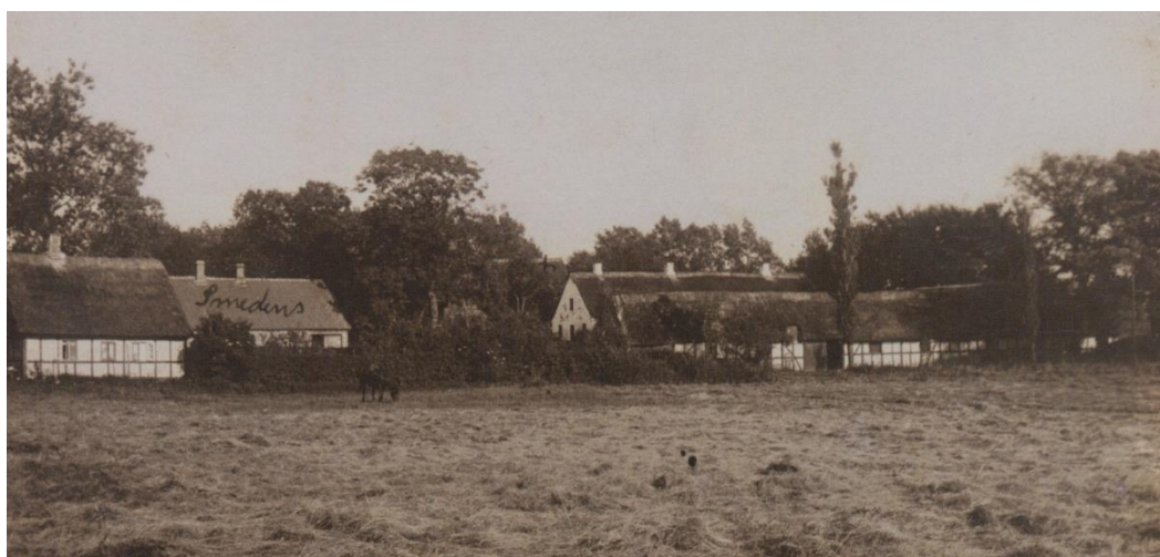
Bysmedens hus ses her bag Enghuset til venstre i billedet. Bysmedens hus er Stenbjergvej 9, Enghuset nr. 6. Gården til højre i billedet må være den nuværende Sloths gård (nr. 11).