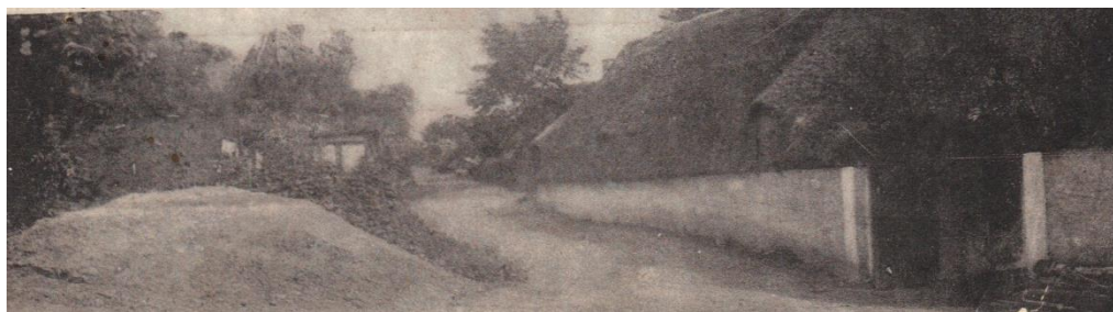
Lottebakken ca. 1910. Lottehuset til venstre, Mosegården til højre.

På et tidspunkt er der blevet solgt et stykke jord fra skolen til Lottehuset, idet skolens have tidligere gik et langt stykke langs Lottebakken og næsten helt ind til Lottehuset viii .