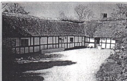
Kærtoften 10, opført ca. 1750