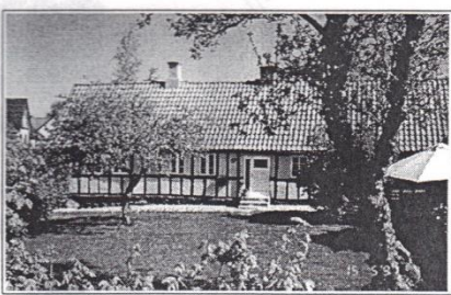
Kærtoften 9, opført ca. 1890