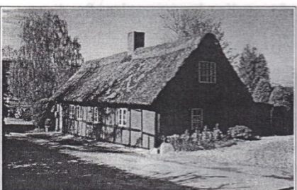
Kærtoften 12, menes opført i 1700-tallet