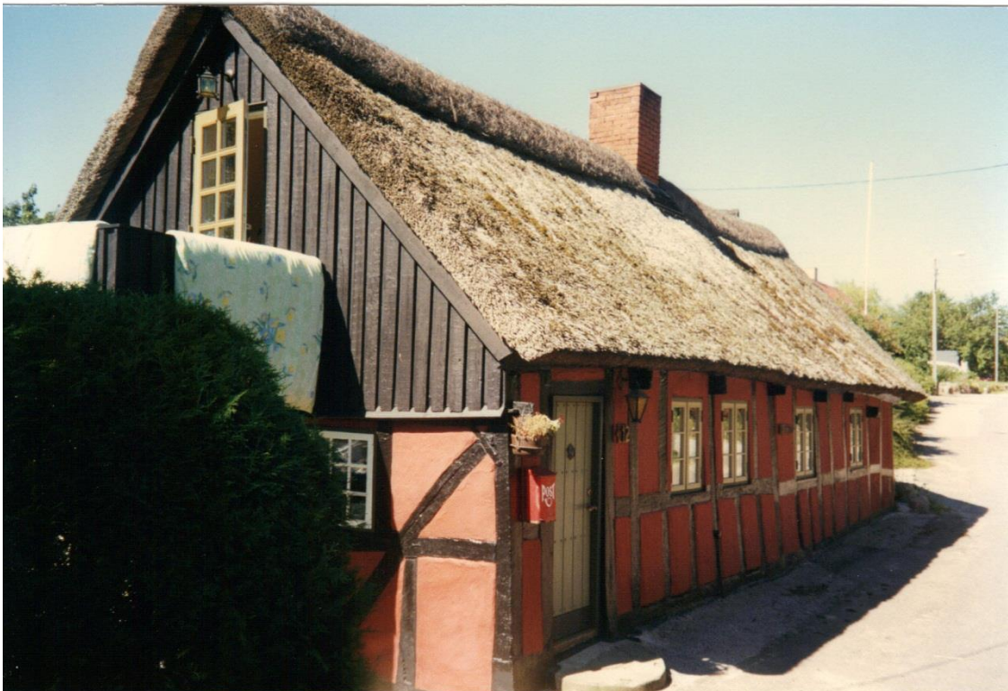
Bækhuset, fotograferet 1997. VFH.

Huset er ualmindelig velholdt og med sit røde bindingsværk en af de huse, der er med til at fastholde det oprindelige præg, som landsbyen Kejlstrup stadig har. I samspil med Fogedgården og købmandsgården overfor kan man godt føle sig hensat til et århundrede tidligere, når man står ved Bækhuset og kikker op mod svinget ved Fogedgården.