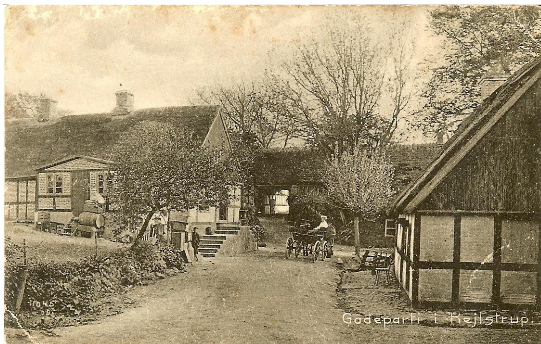
På dette billede fra ca. 1910 ses Bækhuset til højre. Til venstre er det købmandsgården, bagerst i billedet Fogedgården.