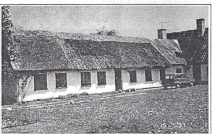
Kærtoften 7, opført ca. 1790