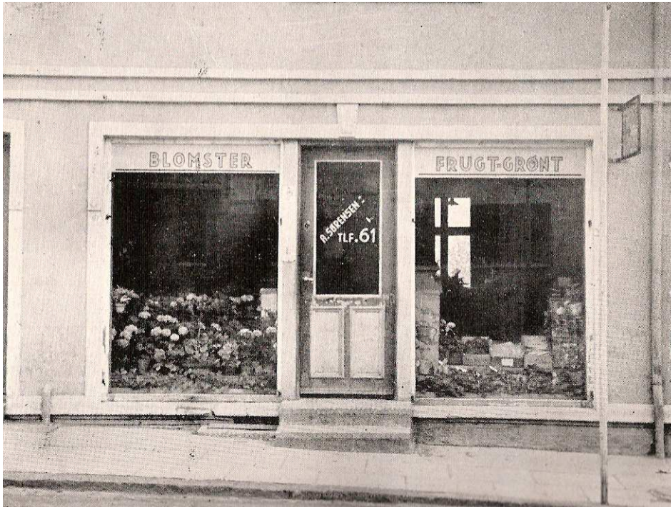
Figur 5. Anker Sørensens handelsgartneri 1945.