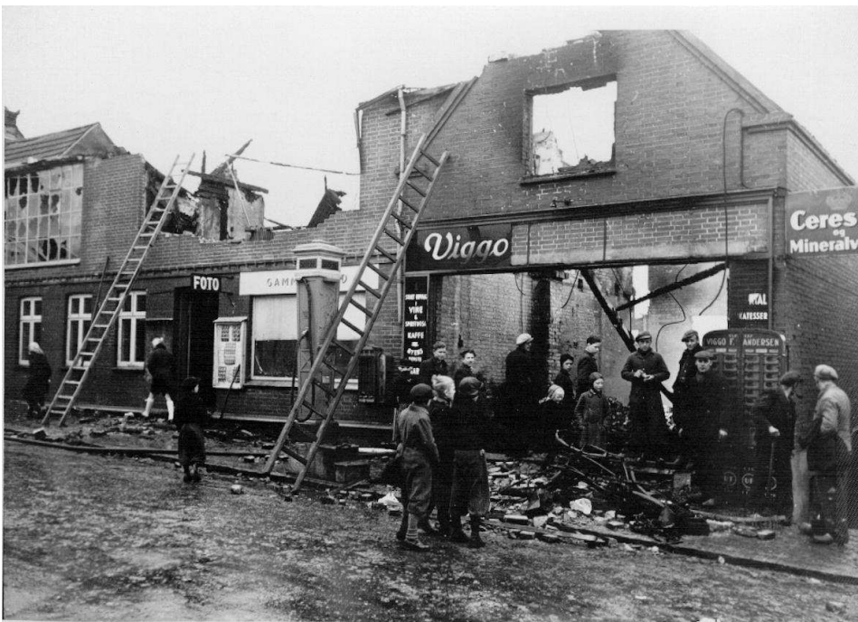
Figur 2. Branden 1944, Gammelgaards fotograf forretning og Viggo F. Andersens købmandsforretning. Branden opstod i købmandsforretningen, men som det ses udbændte fotografens øverste etage med atelier også totalt.