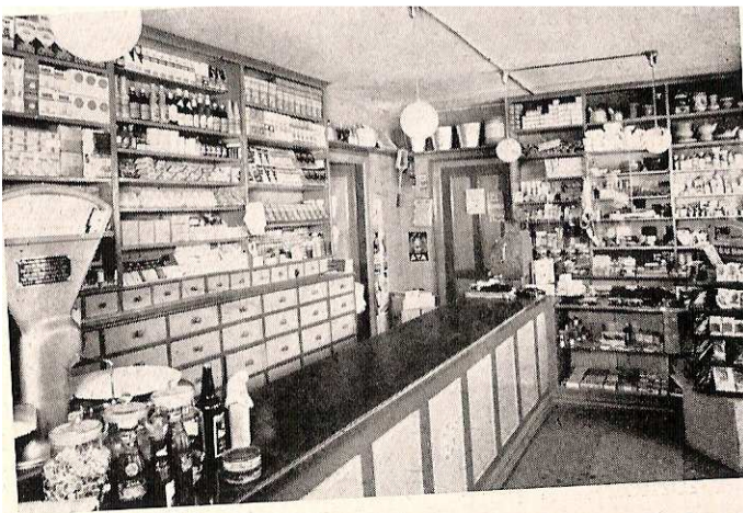
Figur 8. Kjørrumgaard's købmandsbutik, interiør, 1945