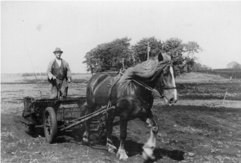
Figur 17. Dyndvogn