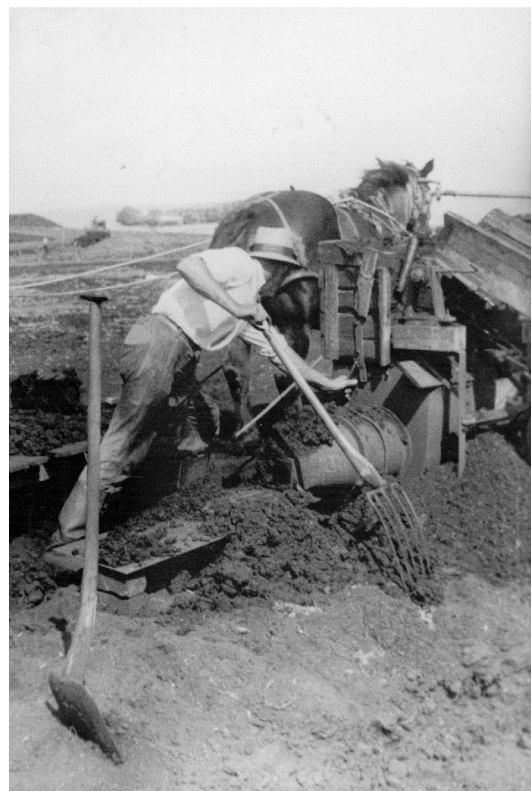
Figur 6 (til højre): Tronholm. Tørvpresser. Her produceres "pressetørv". Smuld fra løs tørvjord smides i tørvpresseren, der presser den til "faste" tørv, der så transporteres ud på liggepladsen til tørring.