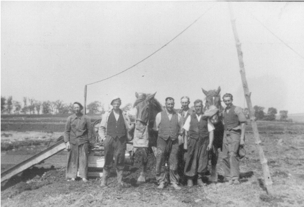
Figur 13. Tronholm. Et tørvehold, der producerer pressetørv, tørvepresseren står bag dem. I baggrunden anes liggepladsen. Der var "indlagt" elektricitet i tørvemosen – en elledning ses mellem de to granrafter.