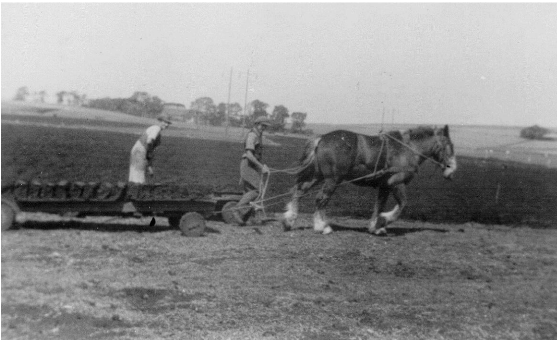
Figur 8. Vognen med de pressede tørv kører ud på liggepladsen. Bag vognen ses pladsen med store arealer med tørv lagt til tørring. Tørvegriben, som manden på vognen håndterer, var med særlig lange tænder, så man kunne have rigtig mange tørv i hver grebfuld.