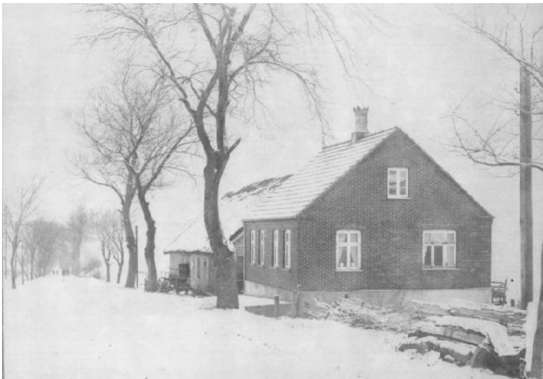
Huset i Bejdsborg, med Tander-laden bagerst, ca. 1910. Huset er siden blevet forlænget, så der i dag er seks vinduer i facaden. Som det ses var der ingen bebyggelse fra huset mod Følle. Der var træer på begge sider af vejen helt fra Rønede til Følle.

Udhuset til det nye hus blev almindeligt kaldt "Tander-laden", og den lå, hvor "Lindehuset" (Hovedgaden 68) ligger i dag. Formodentlig var den bygget af smeden og lå på stedet, før mine forældre flyttede dertil. Der har været brug for en lade til landbruget.