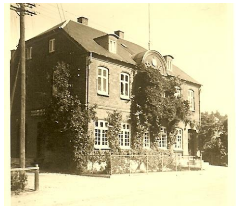
Det nye posthus, nedrevet 1972.

Røgmanden havde tidligere haft Åkjærslund, der blev