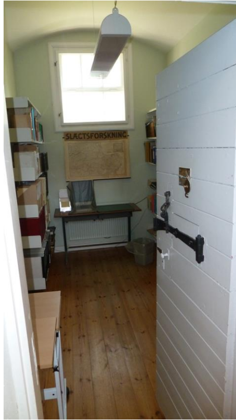
Til højre indgangen til arresten, nu egnarsarkivet. Til venstre en celle, nu med egnarsarkivets reoler