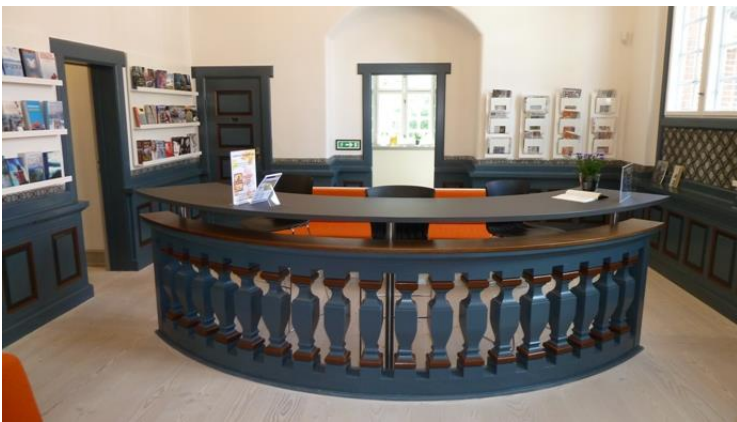
Den tidligere vidneskranke har fået ny anvendelse i biblioteket.