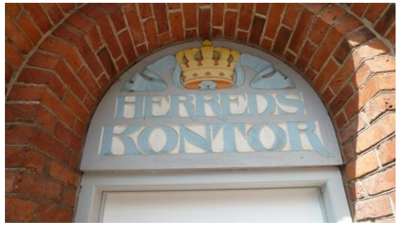
Eksempler på Hack Kampmanns udsmykninger over dørene