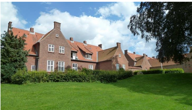
Hack Kampmanns bygninger set fra havesiden. Dommerbolig til venstre, arrest og tinghus til højre