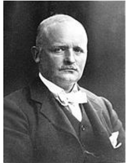
Hack Kampmann (1856-1920)

Den kendte arkitekt og kgl. bygningsinspektør Hack Kampmann har stået for opførelsen af usædvanlig mange bygninger på Djursland. De fleste af dem er opført i de to første årtier af 1900-tallet. I den ene ende af perioden finder vi Kalø Jagtslot, der er opført i 1899. I den anden ende finder vi den gamle toldkammerbygning i Ebeltoft, der nu er glasmuseum, og som blev opført i 1921 efter Kampmanns tegninger (Kampmann døde året før – han var i øvrigt præstesøn fra Ebeltoft). I perioden mellem de to ovenfor nævnte bygninger stod Hack Kampmann som kgl. bygningsinspektør for opførelsen af arresten, tinghuset, herredskontoret og herredsfogedboligen i Hornslet i 1910 (indviet 1911). Det er disse bygninger, der nu fungerer som bibliotek og egnsarkiv, der her skal nærmere omtales.