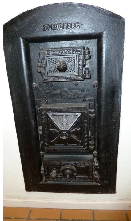
Til venstre madlem og kikhul til celle, til højre en kakkelovn. Hver celle var forsynet med kakkelovn, af rigtig Hack Kampmann-kvalitet, men fyringen foregik naturligvis udefra.