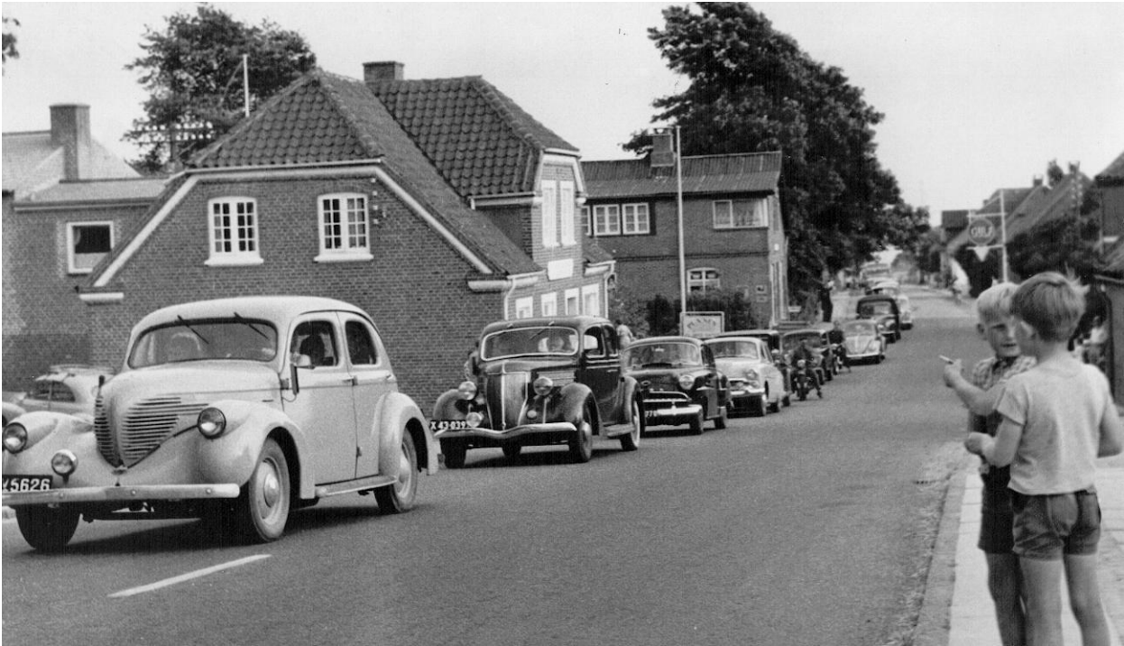
Figur 3. Trafikkøerne på Molsvej, når århusianerne skulle hjem fra Mols efter weekenden, var et eldorado for os drenge. Der blev skrevet bilnumre, og den store gevinst var, hvis man fik et udenlandsk nummer – og det var sjældent. Foto fra 1958, forrest til venstre maleren, bag den vores købmandsbutik. Roar Olsens værksted med Gulf-skiltet anes overfor.

Vi havde ikke grovvarer, men vi solgte briketter, kul og koks i sække, hønse-/kyllingefoder og petroleum. Vi havde et særligt køligt lagerrum til ost, spegepølser, røget flæsk, saltede sild i en stor tønde m. m. Hvis folk skulle have sild, medbragte de egne spande til det.