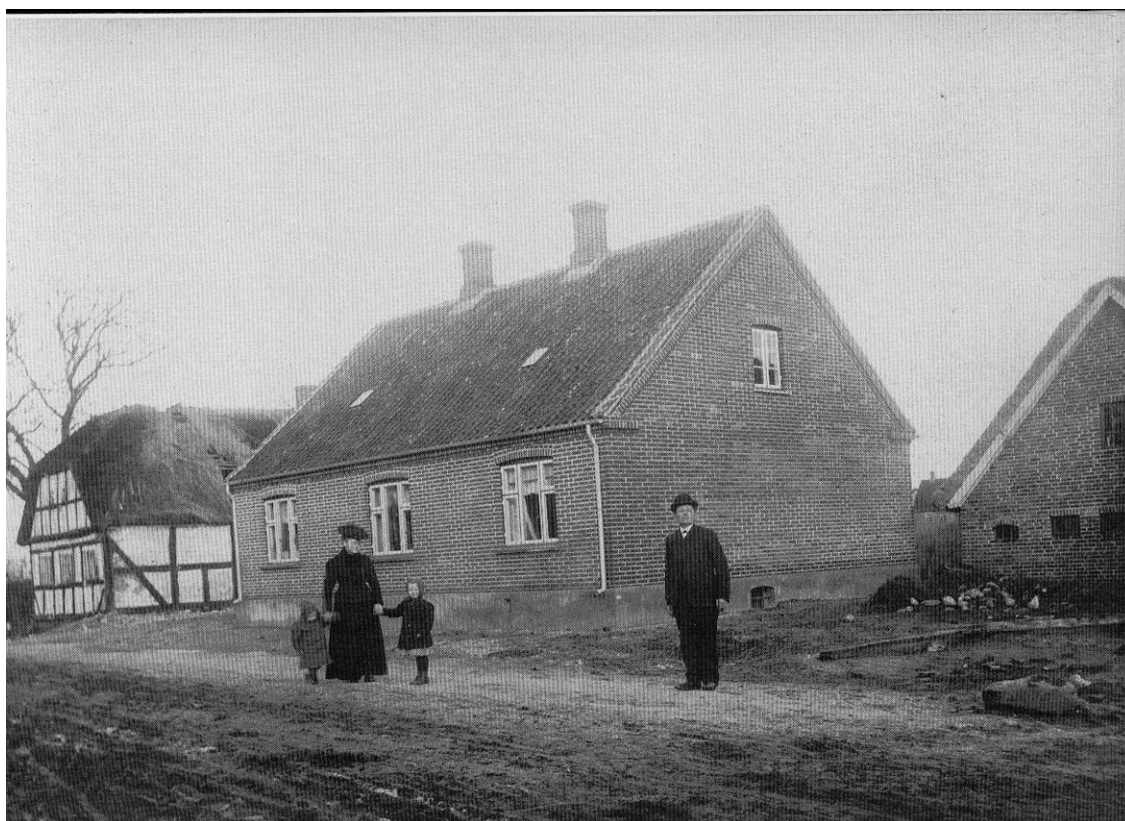
Thorsgade 22, datering lidt usikker, huset bygget 1902, foto kan være taget kort efter, men er i Egnsarkivet dateret til ca. 1925.