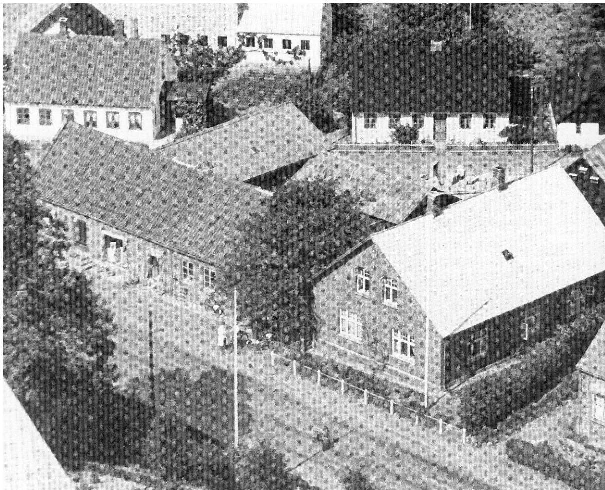
Brugsen ca. 1950, uddelerboligen til højre