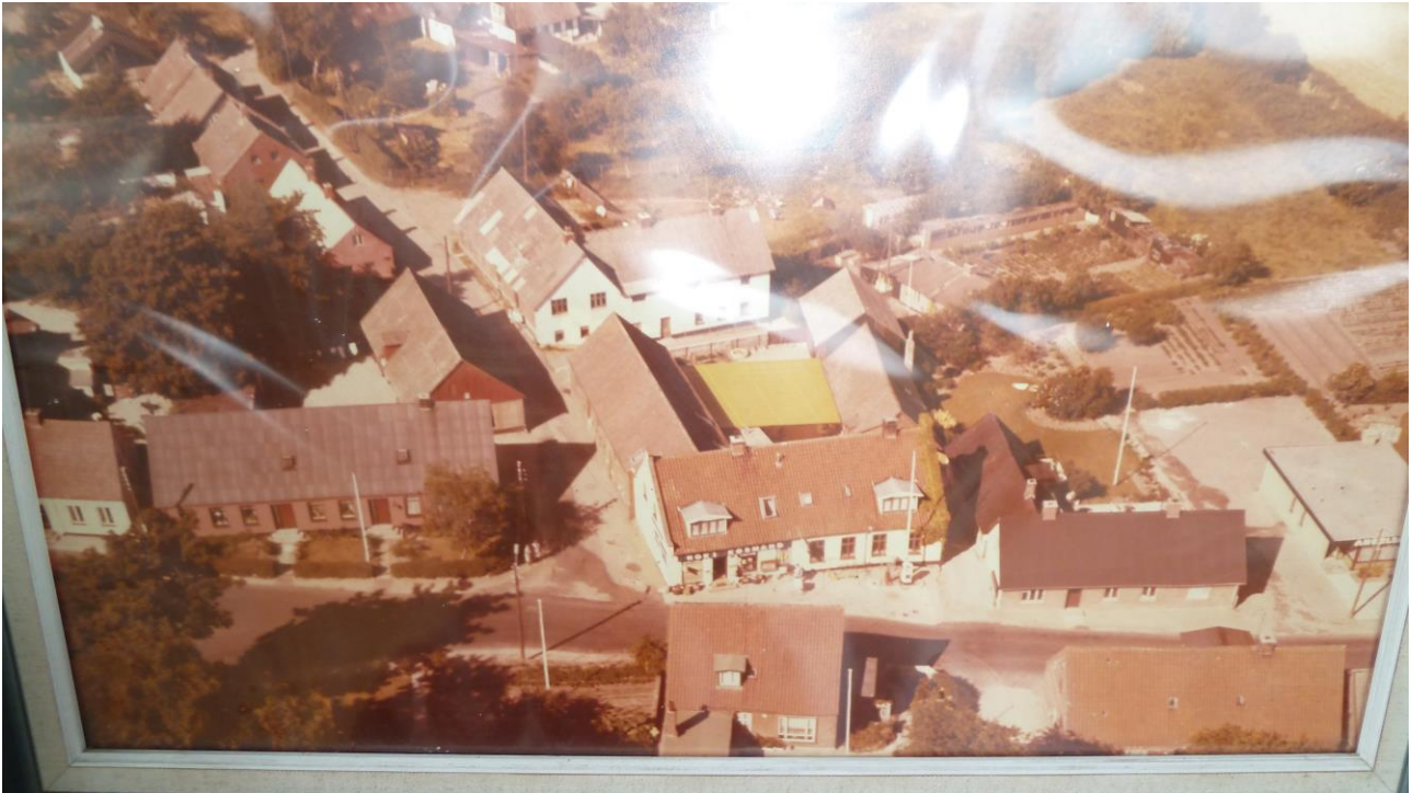
Thorsager bymidte omkring 1970. Motormøllen er den hvide vinkelbygning bag købmandsgården. Fru Bachs hus til højre for butikken er endnu ikke købt, og til højre står den gamle kro og central med kørestalden bagved stadigvæk urørt, så Lille Randers var meget smal mellem kørestalden og motormøllen. Andelskassen yderst til højre i billedet har endnu ikke fået overtage på.