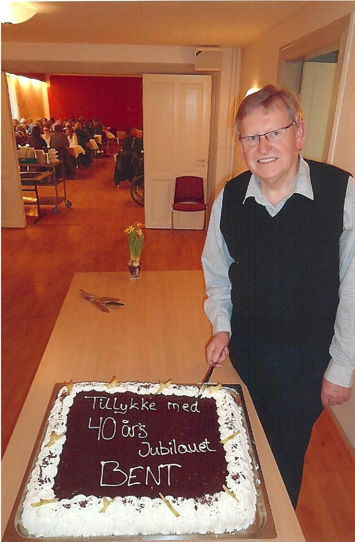
40-års jubilæet i forsamlingshuset fejres med lagkage. Fra mit album.