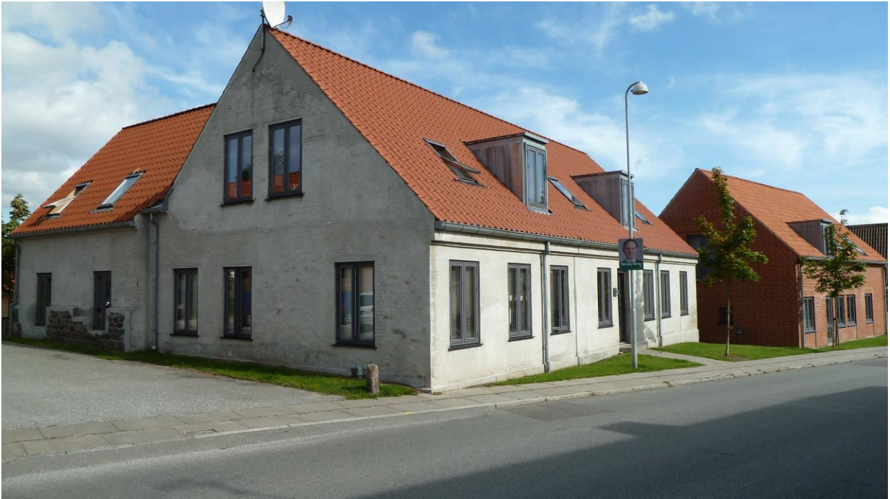
Den gamle købmandsgårds hovedbygning er bevaret, nu med almene boliger. Til højre en af de øvrige boliger på den gamle købmandsgårds grund. Foto VFH sept 2011.

Billeder og billedtekster sammenstillet og skrevet af Vilfred Friborg Hansen til "Folk og Liv 2011", Boggalleriet Rønne 2011, hvor artiklen med billeder kan ses i sin helhed.