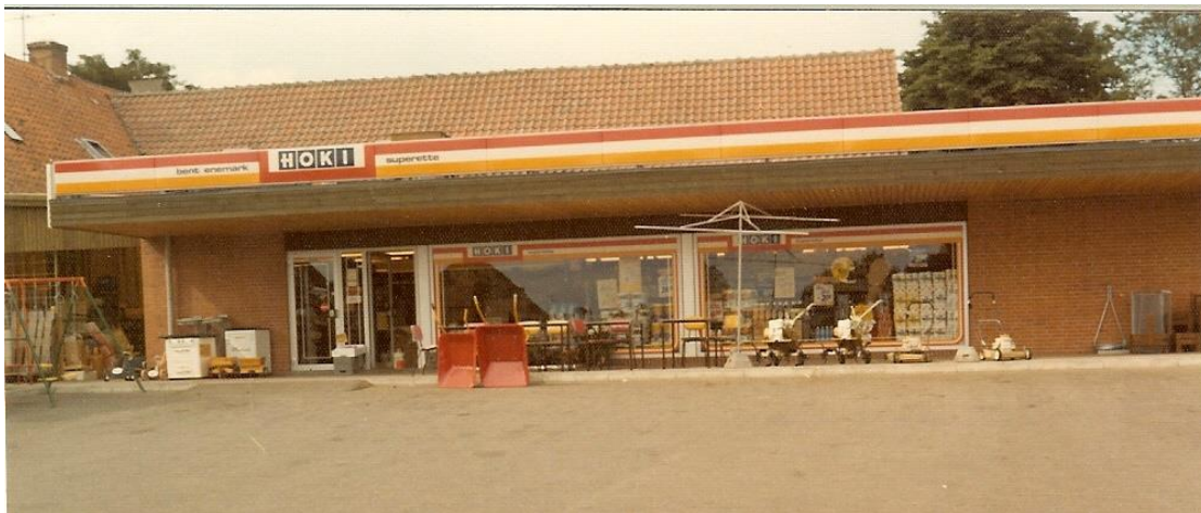
Den nye butiksindgang, ud mod den nye parkeringsplads. Fra mit album.

den gamle motormøllegrund, hvor vi opførte en garagebygning, der ses øverst til venstre i billedet. Kommunen lavede til gengæld legeplads og grønt areal af fru Bachs eng. Foto lånt af Bent Enemark.