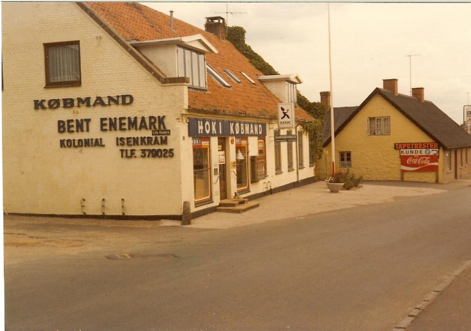
Butikken omkring 1975. Fru Bachs hus er købt, og der er parkering bagude i gården. Fra mit album.