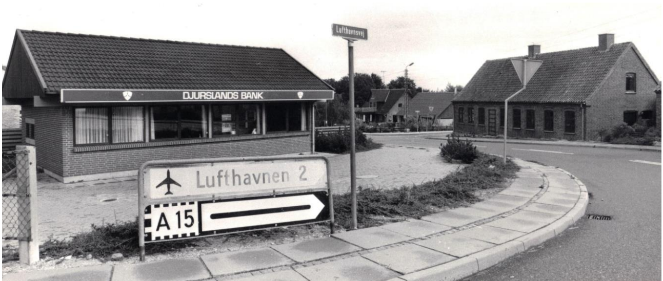
Landevejskrydset i Feldballe ca. 1986