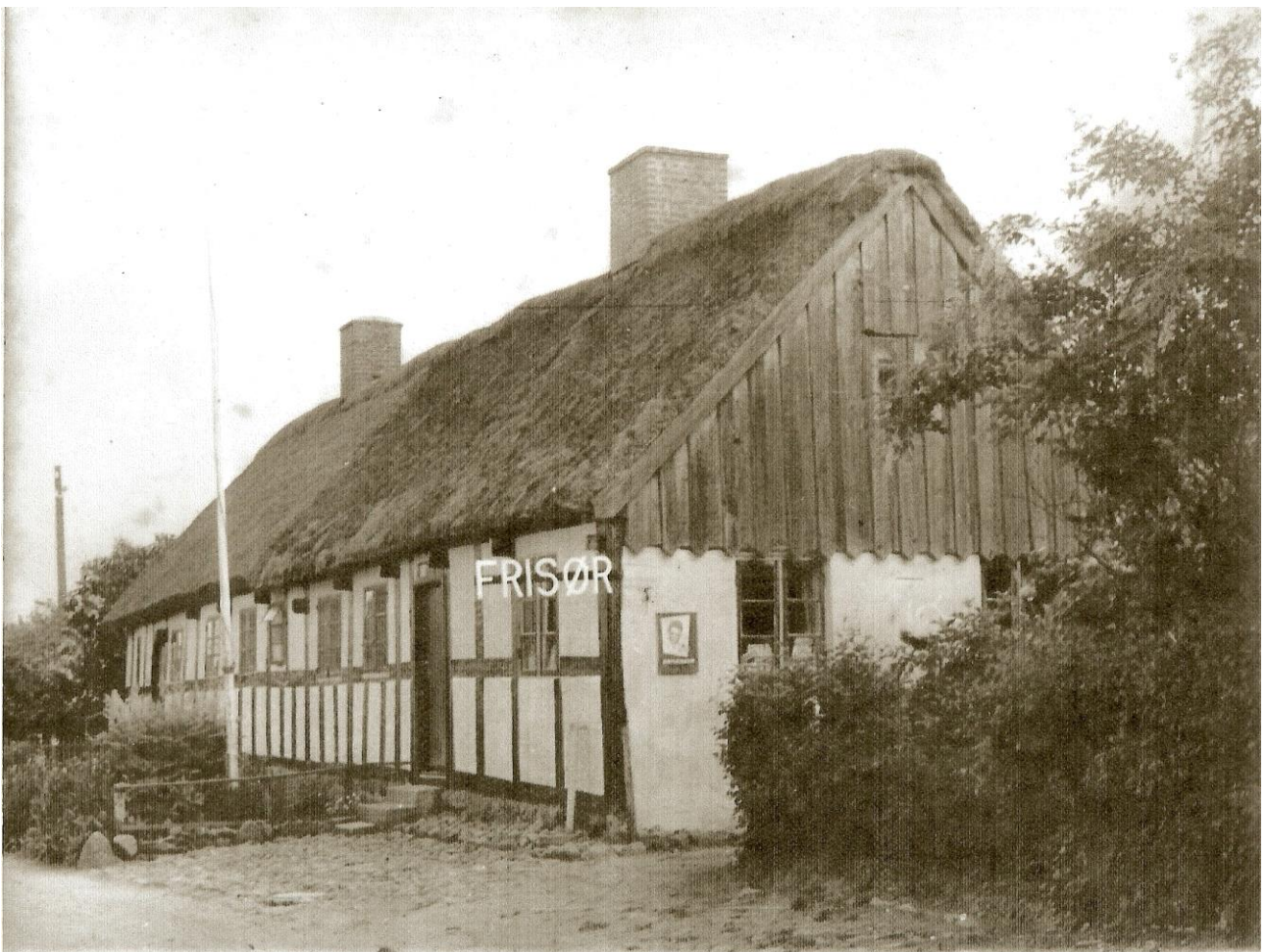
Kirkevænget 2 i Feldballe 1959 med min frisørsalon til højre i billedet.