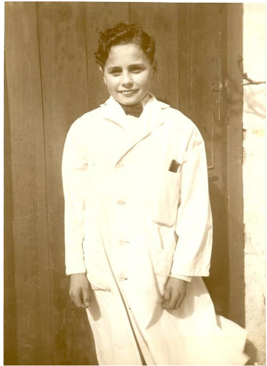
En konfirmeret ”frisør” 1952.

Jeg var til svendep prøve i Nørre Allé Århus – det begyndte skidt, for jeg fik spejl nr. 13, men det endte nu rigtig godt. Jeg er udlært både som herre- og damefrisør. Jeg blev hos Hougaard en kort tid efter at være udlært, havde derefter arbejde hos en frisør i Auning et halvt års tid, hvorefter jeg kom 14 måneder ind til marinen for at aftjene min værnepligt. Det var i 1957.