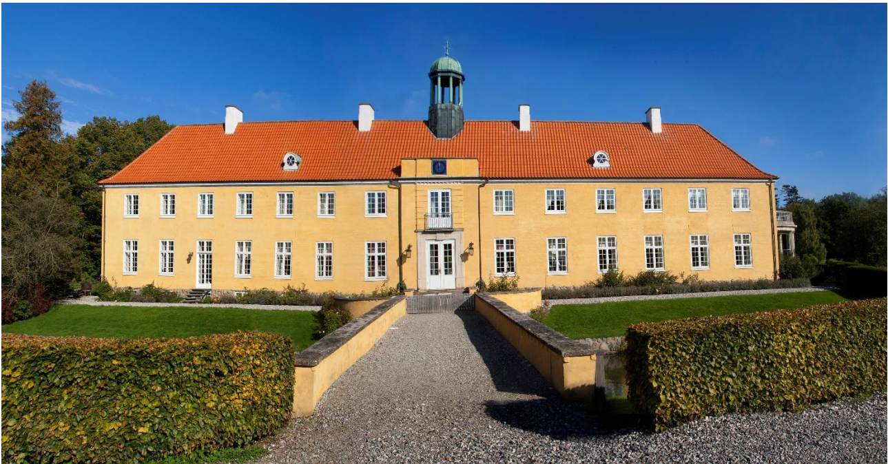
Figur 6. Møllerups hovedbygning i dag – stort set samme udseende som efter restaureringen 1920-21.