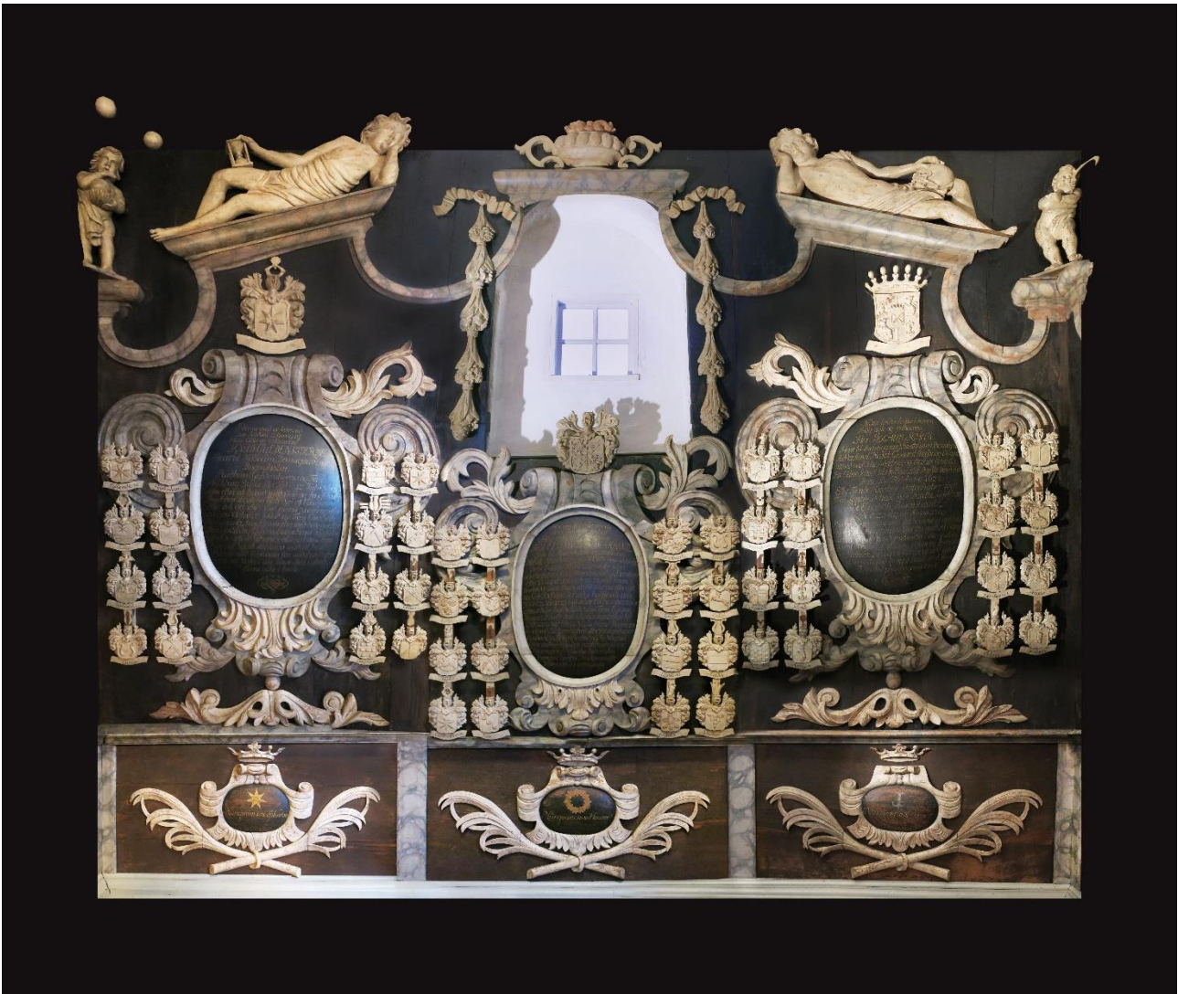
Figur 4. Endevæggen i Elisabeth Rosenkrantz` gravkapel i Feldballe kirke.

Elisabeth Rosenkrantz` udsmykning er i barok stil, præget af barokkens trang til dramatik og bevægelse: snoede søjler, akantusudsmykning, modstillingen af sort og hvidt. En efterligning af barokken i Italien, her blot med den italienske marmor erstattet af gedigent dansk egetræ.