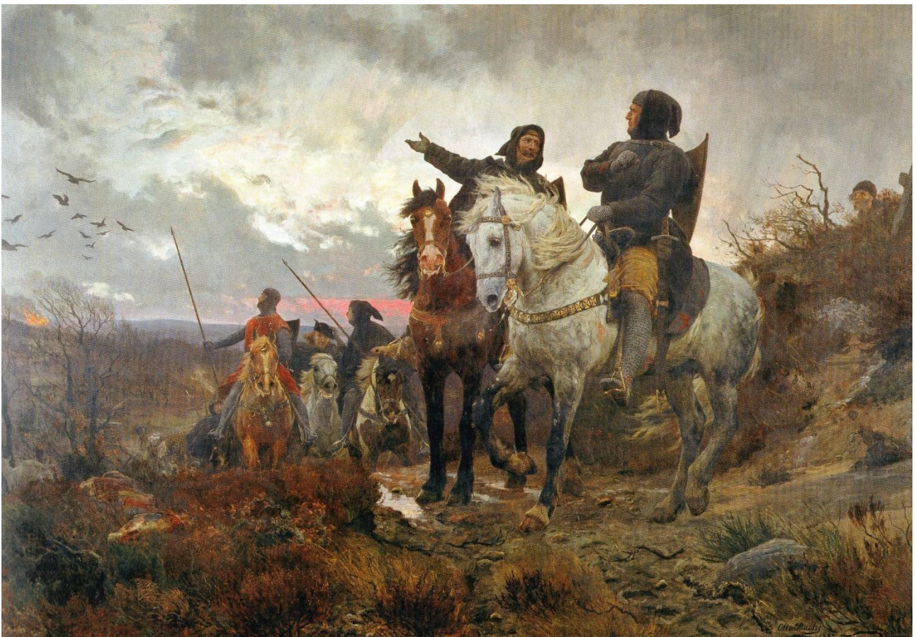
Figur 1. Otto Baches maleri "De sammensvorne rider fra Finderup Lade...", malet 1882.

Møllerup Gods lidt øst for Rønne på Djursland har i mere end syv århundreder været kendt som hjemsted for Marsk Stig, der i 1287 sammen med otte andre blev dømt fredløs for mordet på kong Erik Glipping i Finderup Lade Skt. Cæcilienat året før. En begivenhed, der har givet anledning til et af vores mest ikoniske historiemalerier, Otto Baches "De sammensvorne rider fra Finderup Lade efter mordet på Erik Glipping 1286", der blev malet i 1882 på bestilling af brygger Jacobsen til ophængning i det nationalhistoriske museum på det netop genopbyggede Frederiksborg Slot. Et af forstudierne til maleriet hænger i dag på Møllerup.