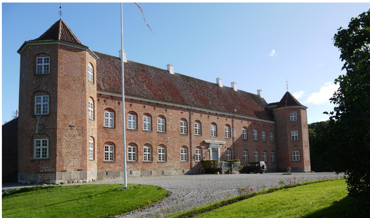
Rugaards hovedbygning. Foto VFH 2012

Rugaards jorder ligger på kanten af den gamle isrand fra det østjyske isfremstød allersidst i istiden, for 12 – 14.000 år siden – et fremstød fra det baltiske område ned gennem Østersøen og derfra nordpå, hvor fremstødet standsede midt på Djursland. De nordlige arealer er dannet af smeltevand fra isen mod syd, de er sandede og stenede, mens arealerne mod syd er aflejring under og foran isranden, og de er – helt modsat - frugtbar og lerede.