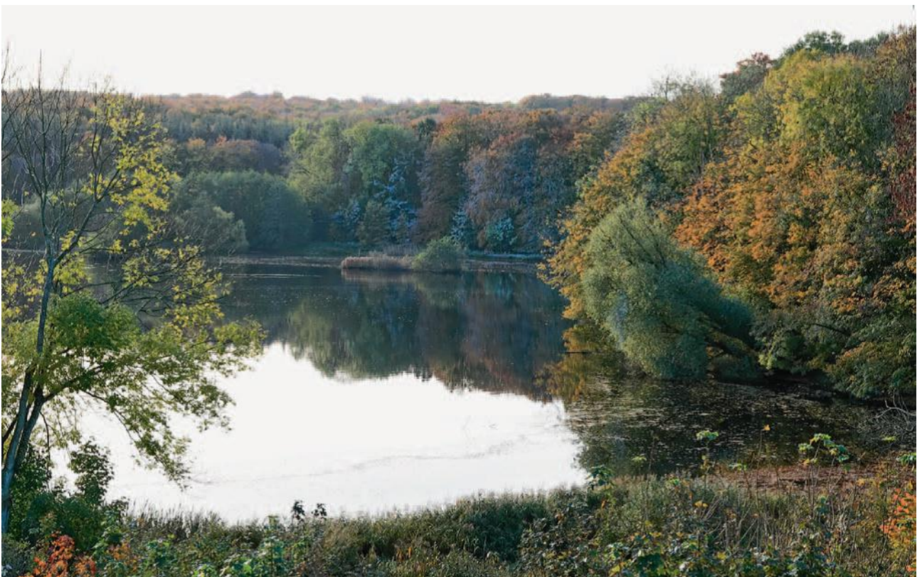
Søndersø i dag, foto fra Kjeld Hansen: Folk og fortællinger.

Kalkbrud, grusgrave og udvindingsret til de grus- og stenrige arealer mod nord er solgt til Nymølle Stenindustrier fra Hedehusene. Jagtret udlejes kun i meget begrænset omfang – Hyllested Jagtforening har af gammel tradition jagtretten i Hyllested Bjerge.