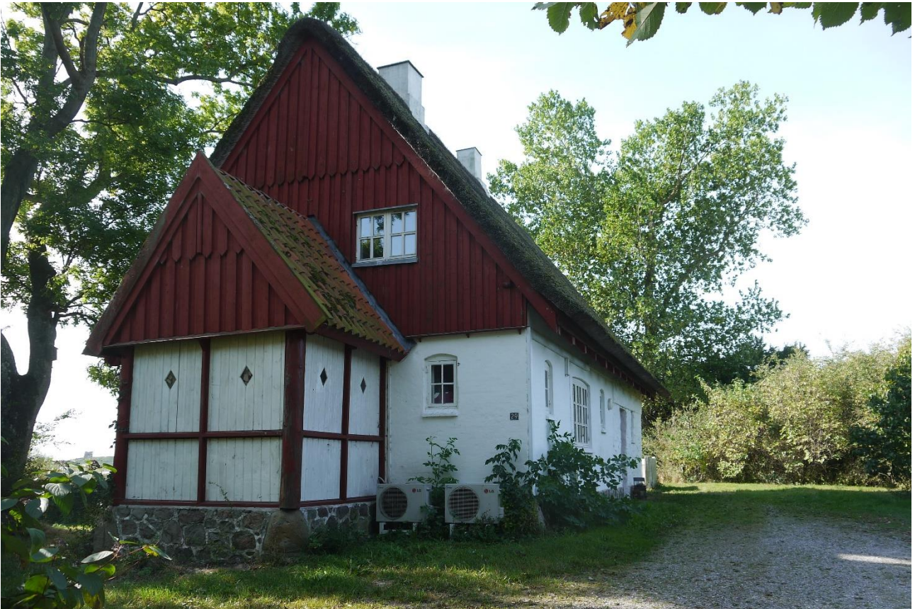
Figur 1. Strandhuset set fra øst. Foto VFH 2017.

"Huset er velproportioneret og velindrettet. I østgavlen ses en lille entré, men der er også indgangsdør mod nord i den anden ende af huset, ligeså dør mod haven. Til loftsetagen er der adgang ad en trappestige 2 ".