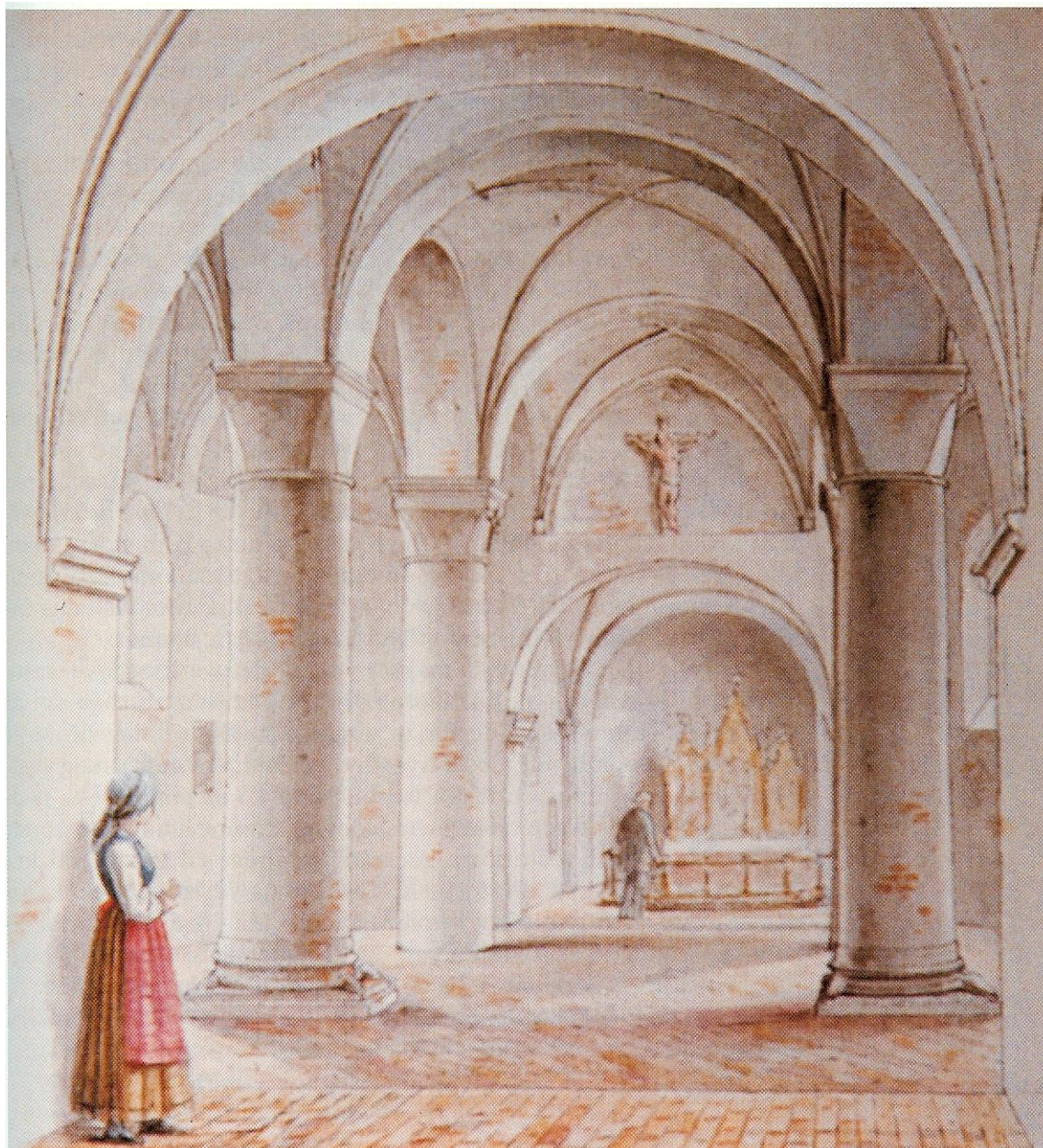
Thorsager kirke før restaureringen i 1877-78. Indre.