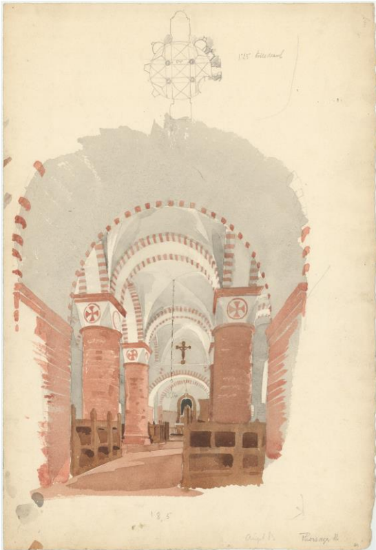
Thorsager kirke efter restaureringen 1877-78. Indre. Akvarel af Hack Kampmann