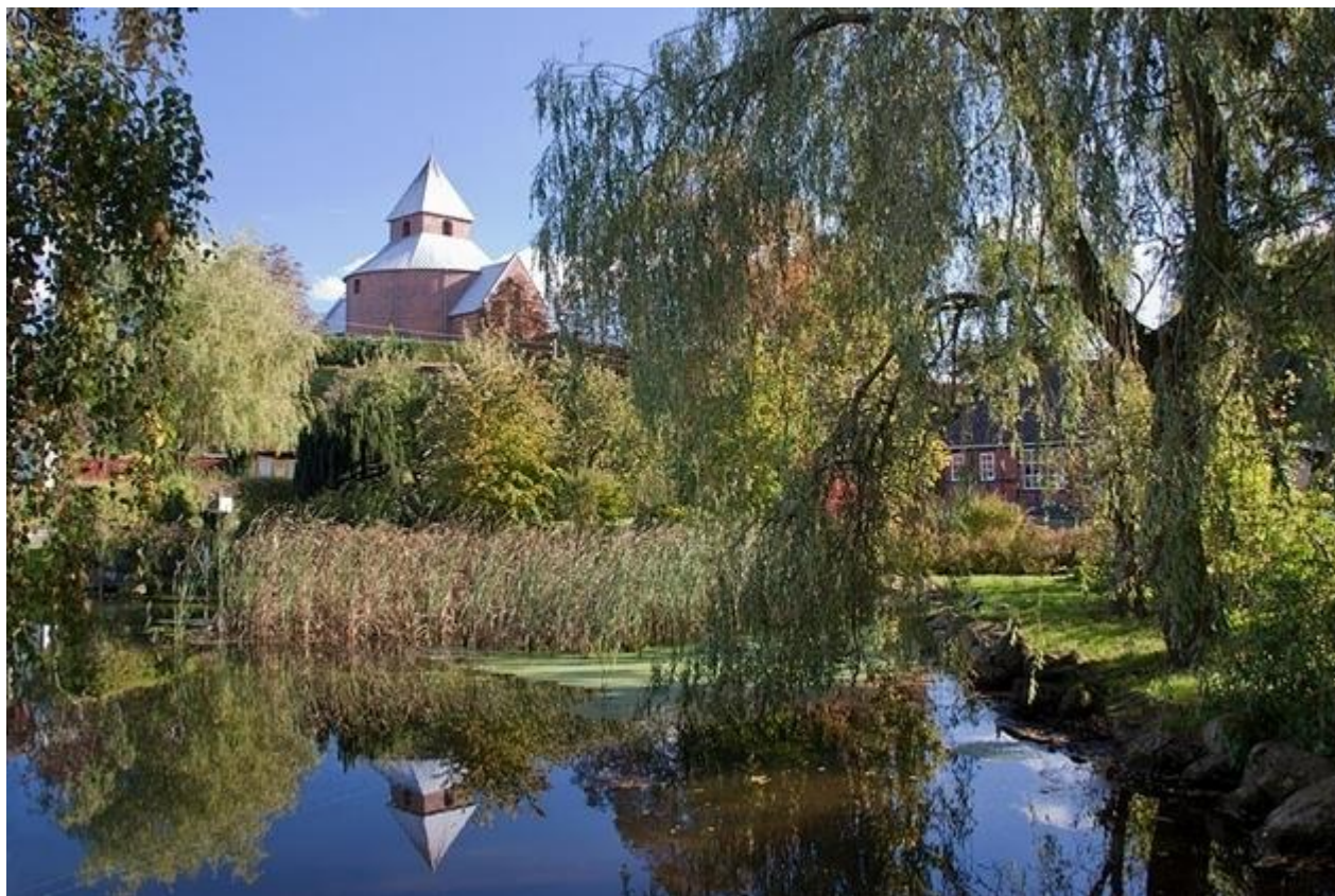
Thorsager kirke i dag, set fra Enghaven.

Indtil færdig holdes gudstjenester i Thorsager og Rostved forsamlingshuse og i Hedekov skole. Begravelser fra kapellet på den ny kirkegård i Vestergade.