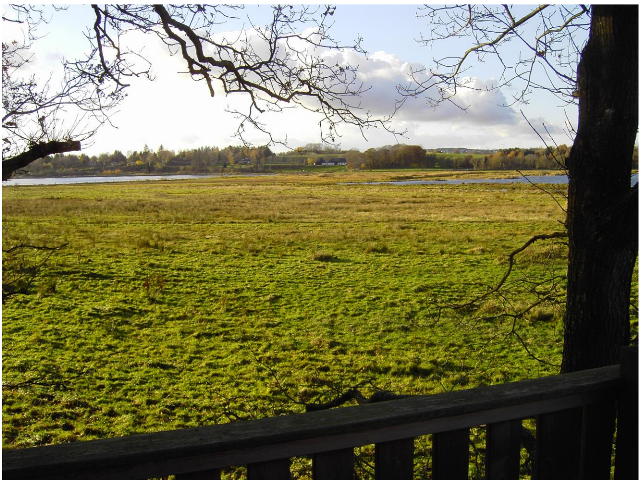
Udsigt fra fugletårnet i Hestehaveskovens udkant over Følle Bund. Til venstre Følle Vig og midt i billedet Følle Strandgård. Til højre en del af den oversvømmede strandeng. nov. 2010.

Følle Bund er en strandeng, dannet ved Knubbro Bæks udløb i Følle Vig, som en slags overgangsområde mellem landet og havet. Den blev inddæmmet og drænet i 1930'erne og fungerede derefter frem til 2004 som et græsningsområde for Kaløs ungvæg – eller som udlejet til andre lokale landmænd til samme formål. Tre jordlodder i området blev efter Kaløs konfiskation i 1945 udstykket til lokale husmænd og blev foruden til græsning benyttet til jagt, idet vildtet fra de nærliggende Kalø-skove færdedes gennem den oprindelige strandeng.