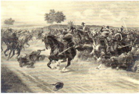
Rytterfægtningen på Skejby Mark d. 31. maj 1849, 1923. Olie på lærred, mål ukendt.

Hansen Reistrup har også fremstillet rytterfægtningen på Vejby Bakke (her dog kaldt Skejby Mark), malet 1923.