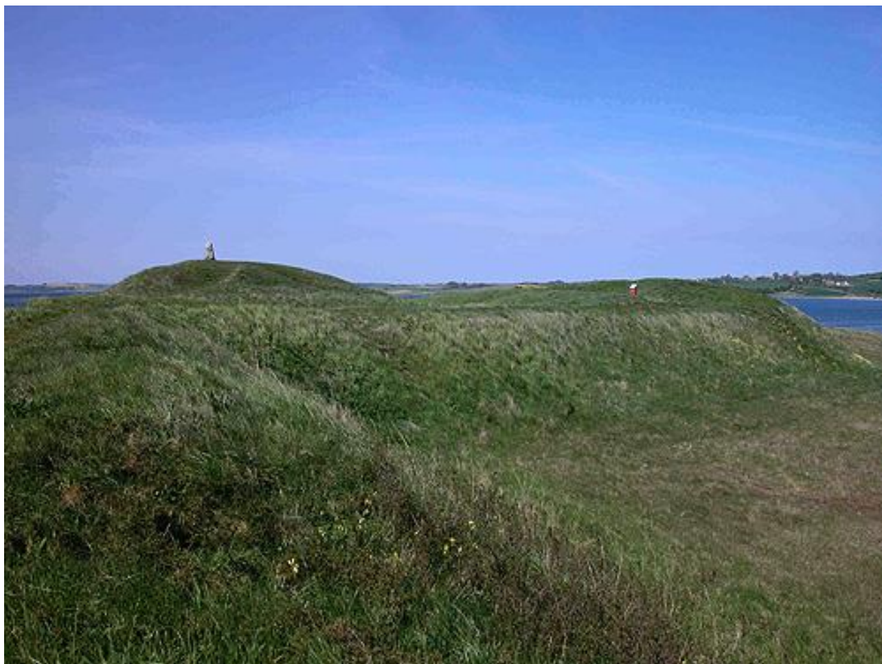
Ryes skanser, hovedskansen set fra øst, fra www.fortidsmindeguide.dk

Udfaldet fra Fredericia var med til at afgøre krigen i Danmarks favør, men det kostede general Rye livet. Efter krigen blev han betragtet som en af krigens helt store helteskikkelser.