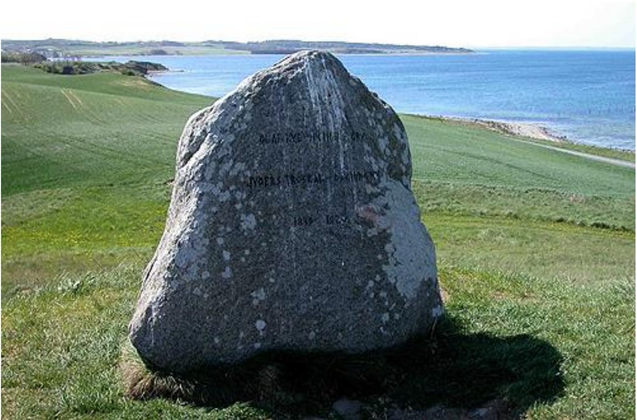
Mindestenen på Ryes skanser.

På skanserne ved Dragsmur blev der 1924 opstillet en mindesten. På hans grav blev der opstillet en buste udført af Bissen, og i Fredericia blev der i 1876 opstillet en buste på Ryes Plads, udført af Andreas Paulsen.