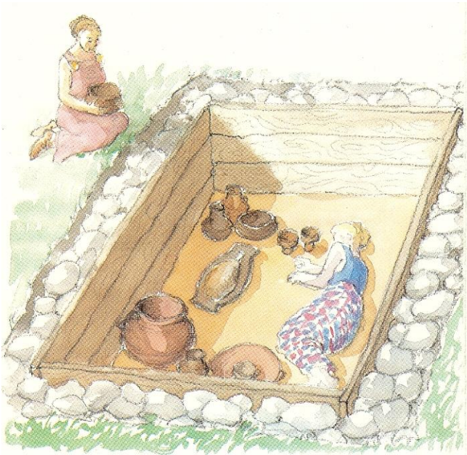
Kvindegraven ved Rostved rekonstrueret. Fra pjecen om stedet.