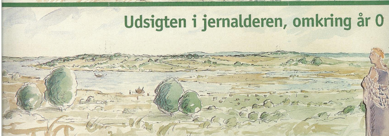
I pjecen om Rostved-gravene har man sammenlignet udsigten fra gravhøjene i 1998, hvor pjecen blev trykt, med udsigten fra samme sted i jernalderen omkring Kristi fødsel.