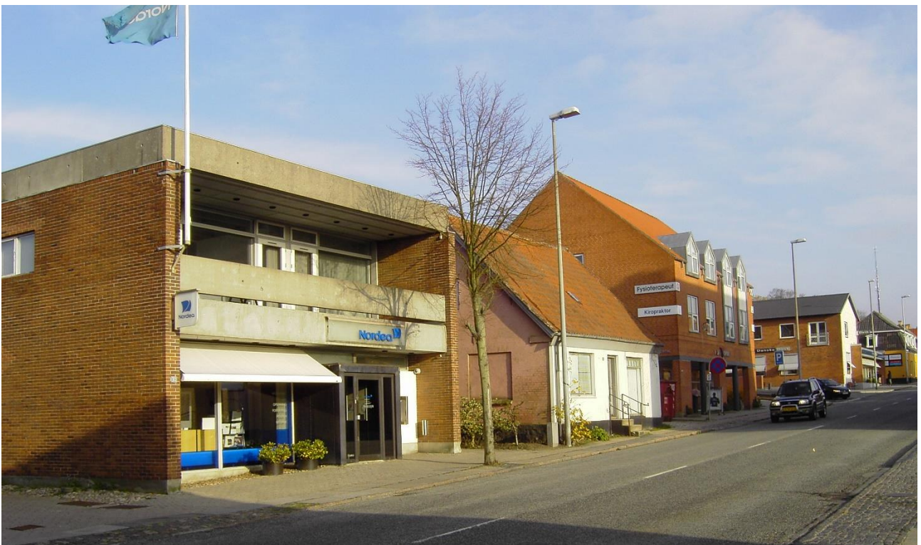
Figur 5. SDS blev 1990 til Unibank, der 2000 blev til Nordea. Her foto fra 2010. To år senere forlod Nordea Rønne.

Andelsbanken, Privatbanken og Sparekassen SDS fusionerede i 1990 til Unibank. I 2000 fusionerede Unibank med den svensk-finske MeritaNordbanken og tog derefter navneforandring til Nordea .