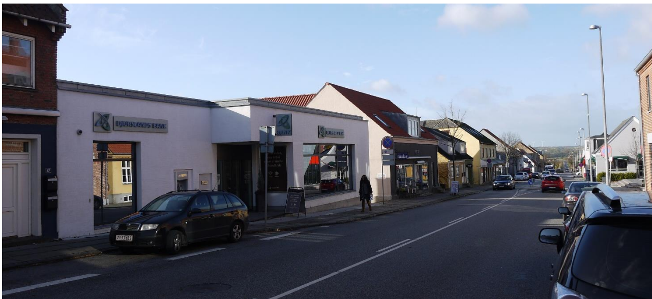
Figur 6. Djurslands Bank kom til Rønde i 1991, ombyggede og udvidede 2006, her banken til venstre i billedet ti år senere. Foto VFH 2016.

Herefter var antallet af pengeinstitutter i Rønde reduceret til fire (fem med Andelskassen): Rønde og Omegns Sparekasse, Djurslands Bank, Den Danske Bank / Danske Bank og Unibank / Nordea, hvortil kom Andelskassen i Thorsager.