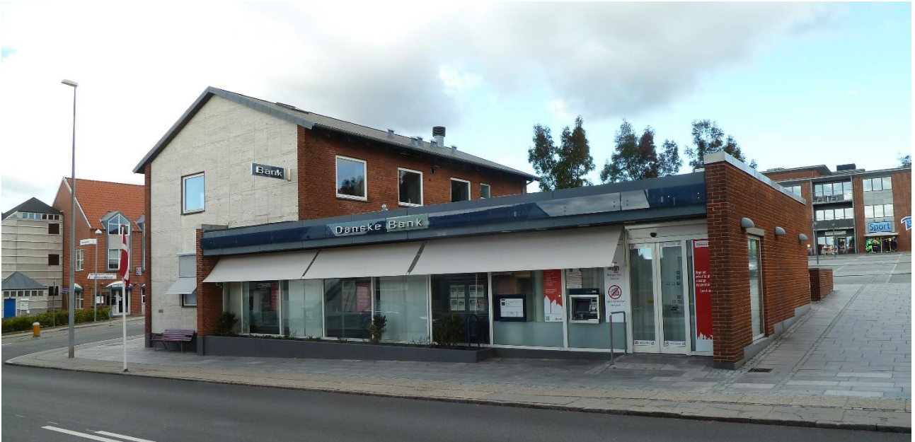
Figur 4. Da Den danske Bank og Provinsbanken fusionerede i 1990, valgte de at benytte Provinsbankens lokaler på Hovedgaden 20. Den danske Banks lokaler på den anden side af Hovedgaden blev i stedet overtaget af Djurslands Bank. Den danske Bank ændrede år 2000 navn til Danske Bank. Her fotograferet september 2013, tre måneder senere forlod Danske Bank Rønne.

Andelsbanken, Privatbanken og Sparekassen SDS fusionerede i 1990 til Unibank. I 2000 fusionerede Unibank med den svensk-finske MeritaNordbanken og tog derefter navneforandring til Nordea .