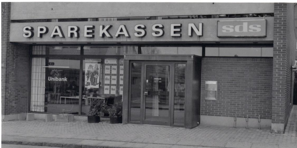
Figur 3. Sparekassen SDS havde til huse på Hovedgaden 30 fra 1976.

Det bør vel også nævnes, at i Thorsager fik Andelskassen egne lokaler i 1967. Der udvidedes stort med bl.a. en etage ovenpå i 1979. En del år senere fik Andelskassen også en afdeling i Tirstrup.