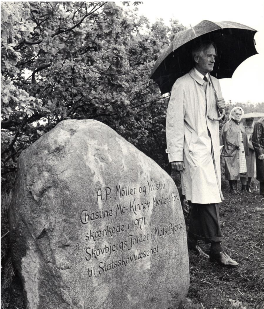
Skibsreder Mærsk McKinney Møller afslører mindestenen på Skovbjerg 1972.