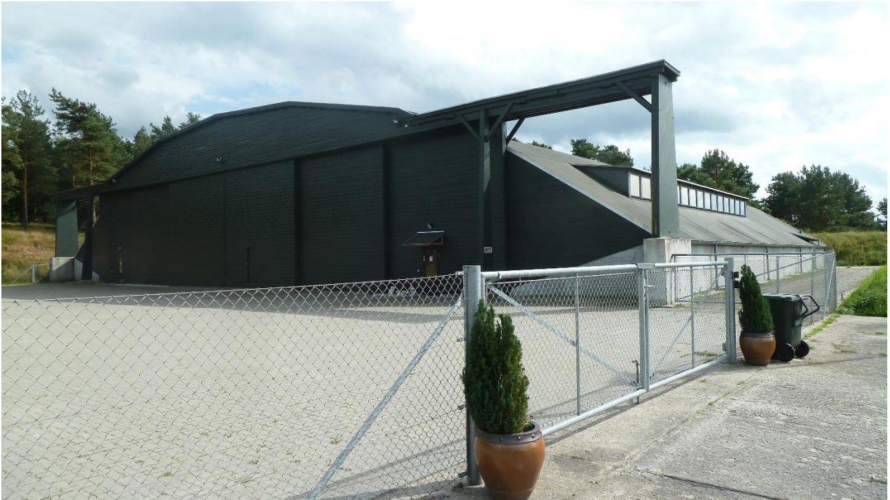
Hangar 17, foto august 2012 VFH.

Tyskerne begyndte byggeriet af Tirstrup Flyveplads i foråret 1944, og her opførte de en række bygninger, bl. a. en kæmpestor hangar, der skulle anvendes til reparation af fly. Der var en kæmpestor hal til flyene, og så var der en række værksteder i de bagerste lokaler i sydenden.