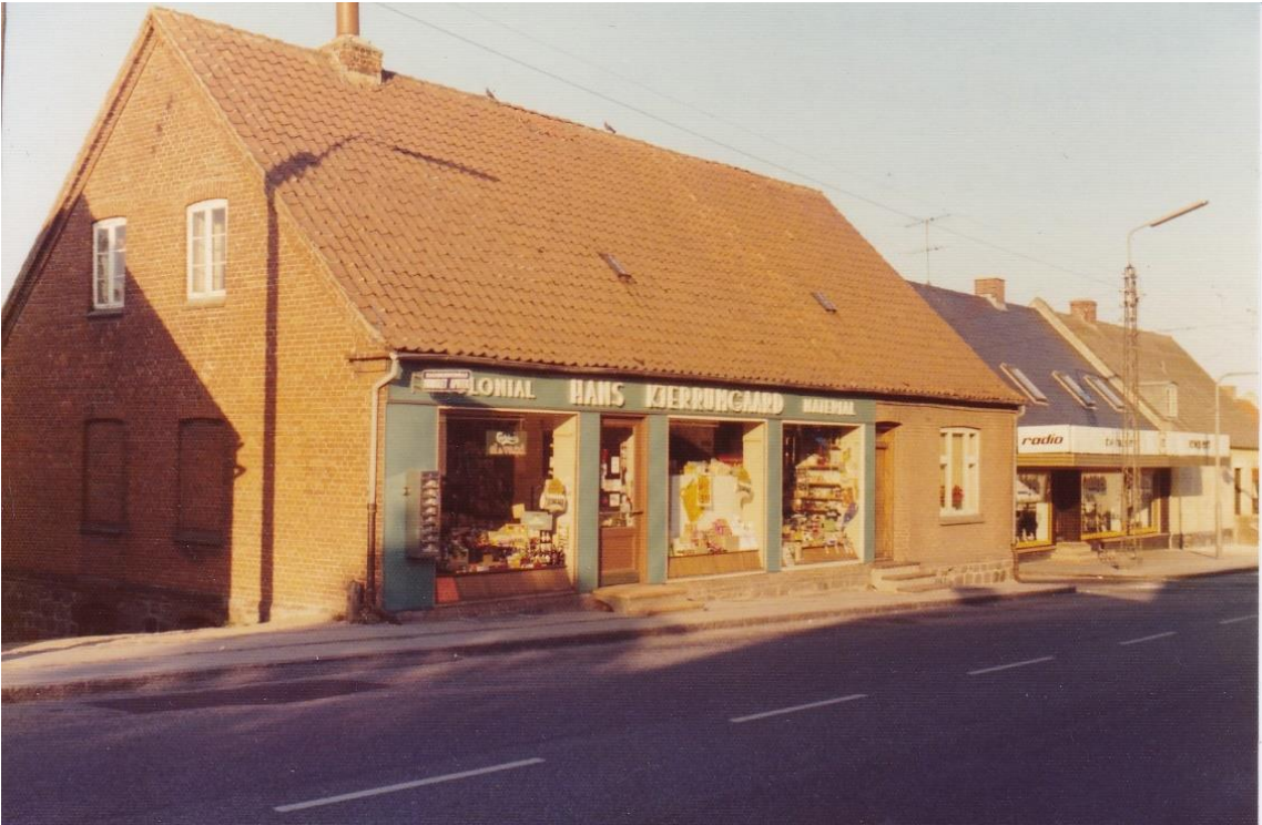
Figur 16. Købmand Kjerrumgaard, foto fra 1979.