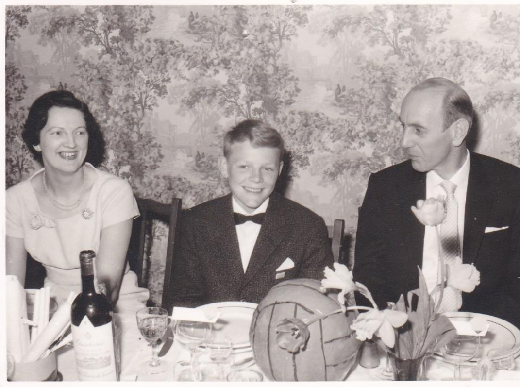
Figur 20. Min konfirmation, det er konfirmanden omgivet af sine forældre, den uundværlige fodbold på bordet. Det foregik på Vægtergården, hvor mor havde været ansat. Foto 24. april 1960.