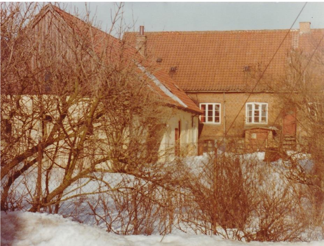
Figur 17. Købmand Kjerrumgaards baghus med lager, foto 1979. Halvdelen af baghuset blev væltet nogle dage senere.