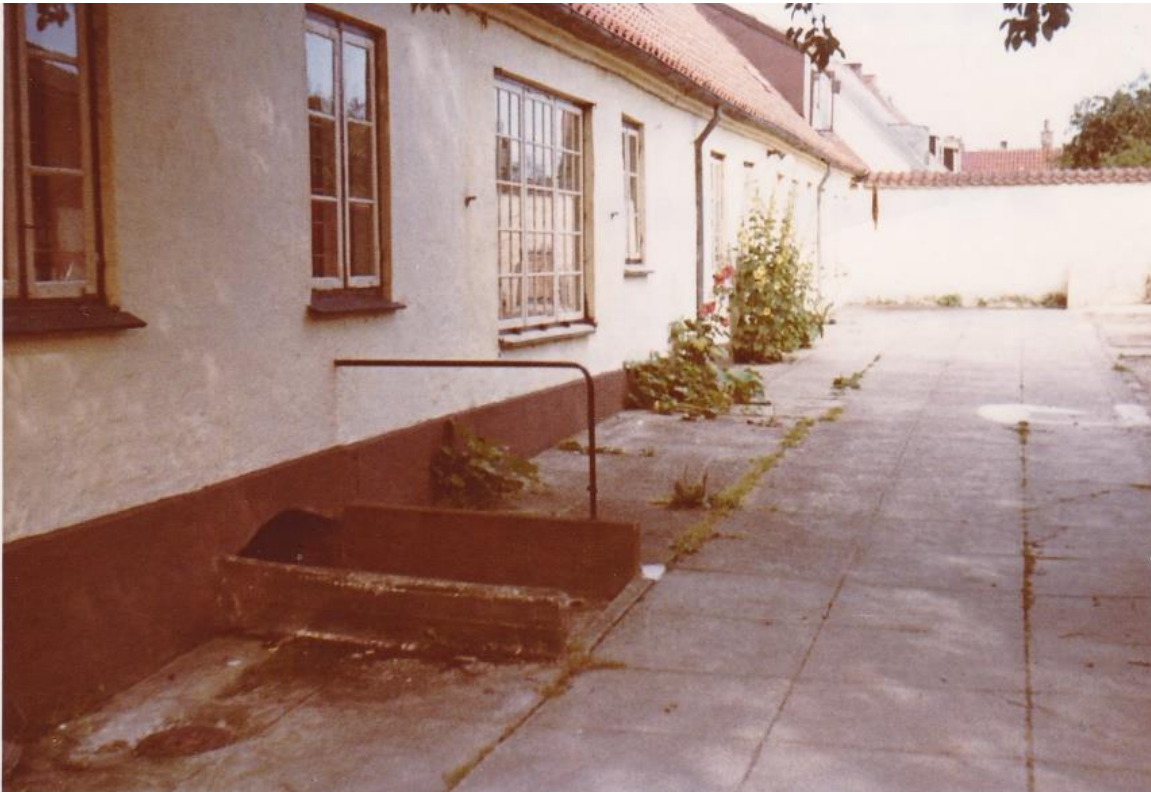
Figur 4. Bagsiden af det lange hus, fotograferet fra vores kvistvindue sidst i 1960'erne. Muren i baggrunden skilte vores hus fra resten af det lange hus.