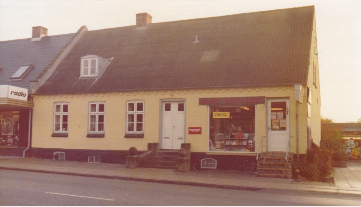
Figur 13. Fru Tanders boghandel. Foto 1975, lige før TV-huset købte huset og udvidede med den. Jensa Tanders mand Viggo Tander havde haft cykelsmedje i ejendommen, men det var før min tid.