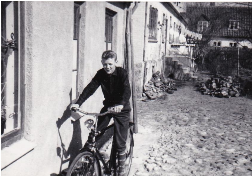
Figur 21. Det nye vidunder: ny cykel ved konfirmationen. Billedet giver også et godt indtryk af baggårdene med de toppede brosten anno 1960.