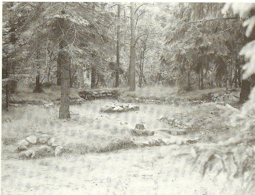
"Dagmarkors-grotten", en af de mange grotter i lystanlægget.