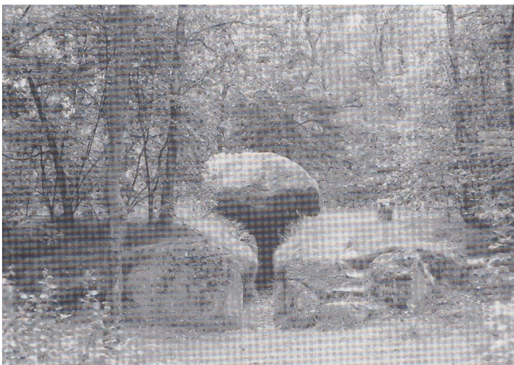
Oldtidshøjen i Taastrup Granskov, fotograferet af forfatteren 1989.

Martens tilføjer, at Taastrup Sande nu er skov og har opnået "et herligt udseende". Derfor bør det fredes i stedet for at bruges som overdrev af bønderne. Det er nødvendigt, hvis "opelskningen af skoven" skal lykkes.