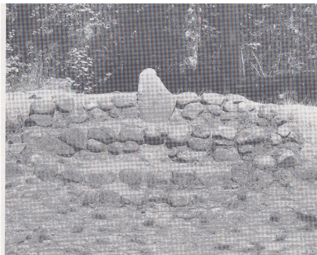
Forsiden af Martens` lystanlæg - det var utvivlsomt her, Martens havde tænkt sig at opstille et monument.

Monumentet til ære for kongen og sandflugtsbekæmpelsen er aldrig blevet realiseret. Der er dog ved indgangen til lystanlægget en plads med enstensætning med en større sten i midten. Det fremtræder som anlæggets midtpunkt, og det er nemt at forestille sig, at hvor den store sten står, har Martens tænkt sig, at monumentet til kongens ære skulle stå.