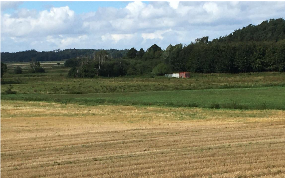
Skoven på næsset øverst til højre i billedet, der skyder sig ud i den udtørrede Korup sø, gemmer de to Barkær-langhøje, ca. bag den rød-hvide dyrefold. Billedet er taget fra Kolindvej, mellem Taastrup-krydset og Barkærvej. Foto VFH 2020.