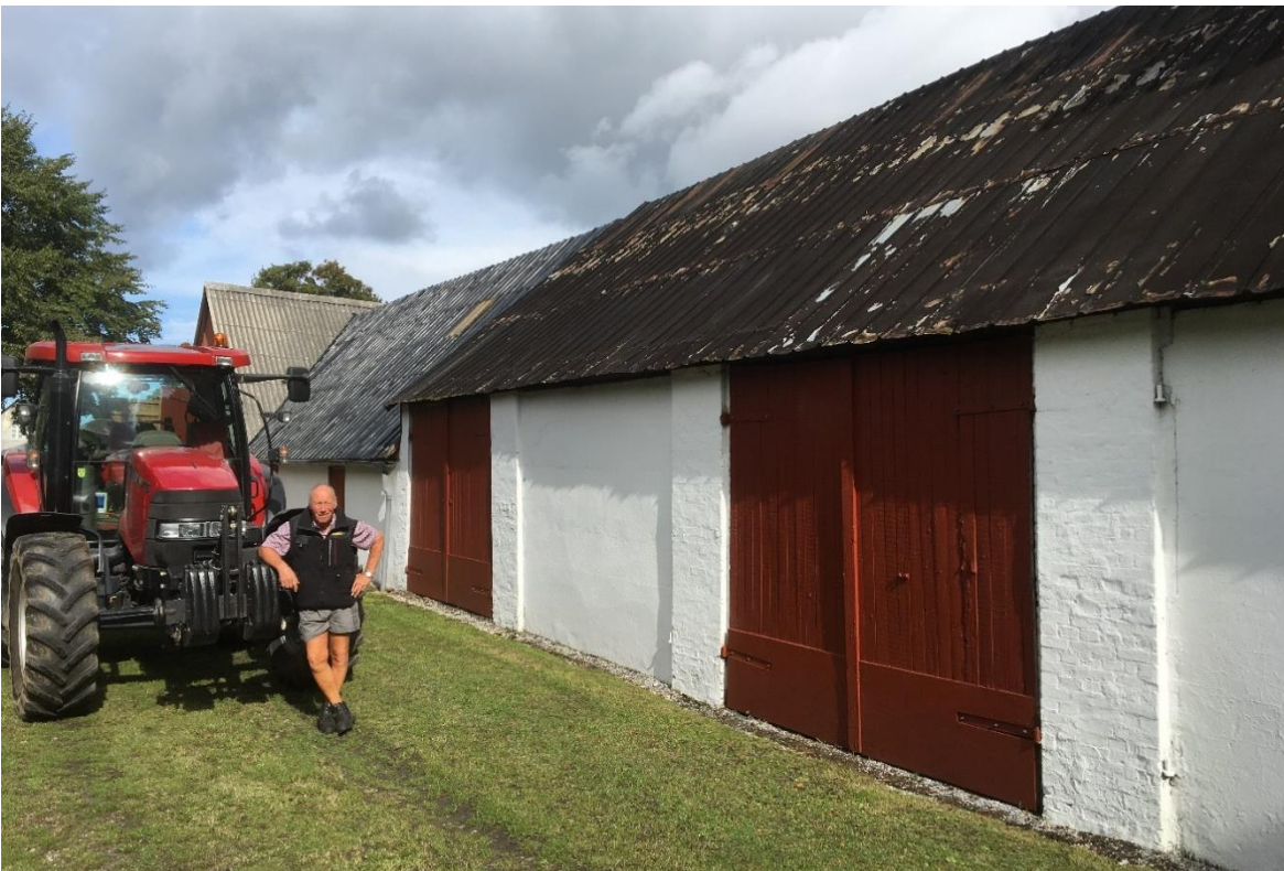
Sydlængen med de fire porte, hvoraf de to anvendes endnu i dag. Taget blev forhøjet af tyskerne, så gendarmeriets biler kunne komme ind – ganske tankevækkende at se Jes Thomsens moderne traktor ved portene i dag. Den kan slet ikke komme ind.