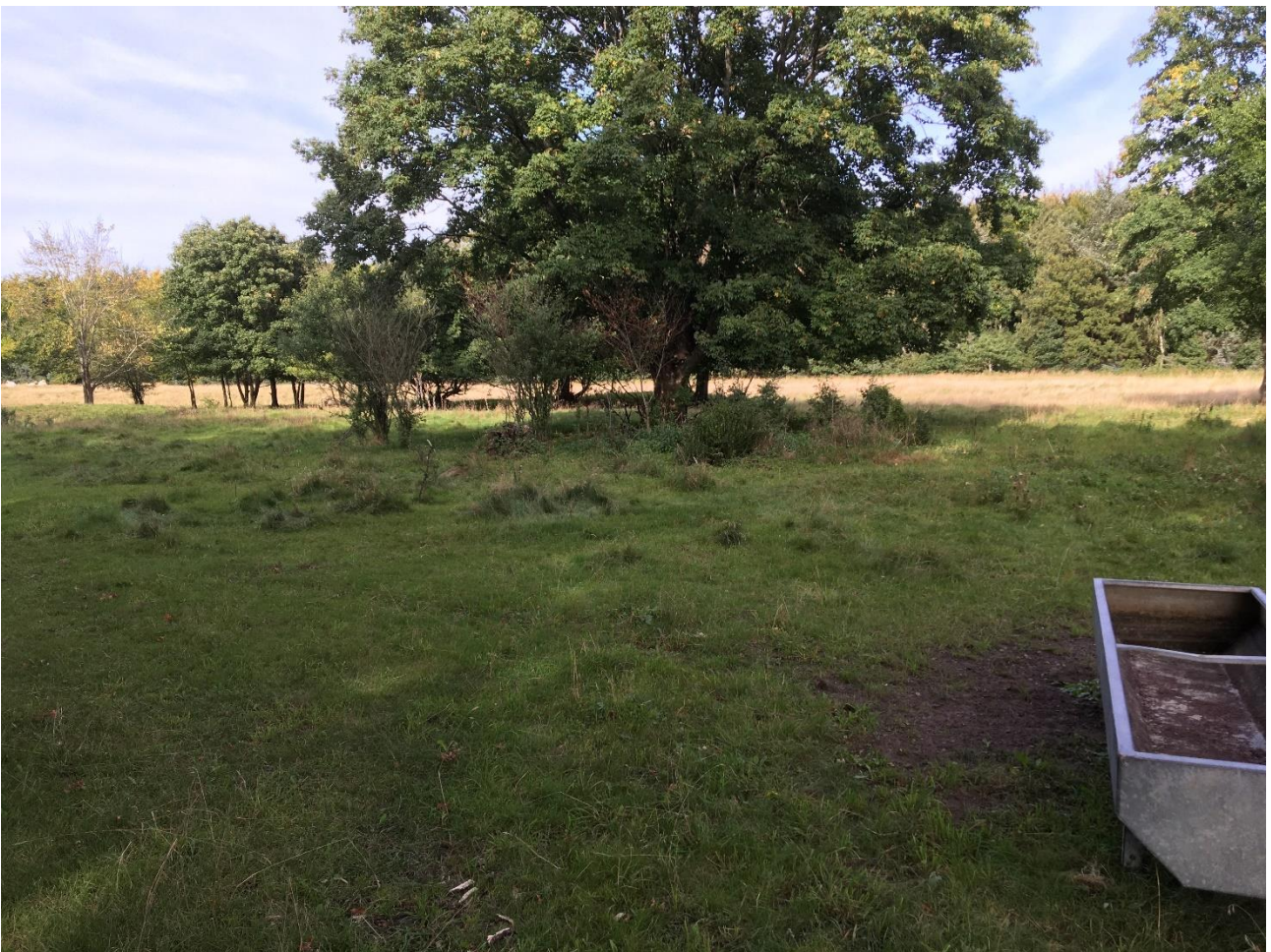
Tomten efter Hellesvad, vest for Sognevejen (den gamle Feldballe – Nøddager vej), foto sept. 2002. VFH.