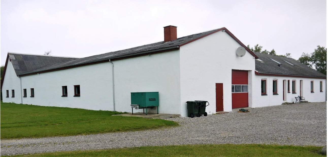
Enghavegård i dag – en helt anden gård. Forrest i billedet teater- og biografalen, til højre stuehuset, til venstre i baggrunden gavlen af den længe, der har rummet bade faciliteter og aflusningsanstalt. Efter krigen blev teater- og biografalen ombygget til lade, og bade- og aflusningslængen til ko- og grisestald. Foto VFH juli 2020.