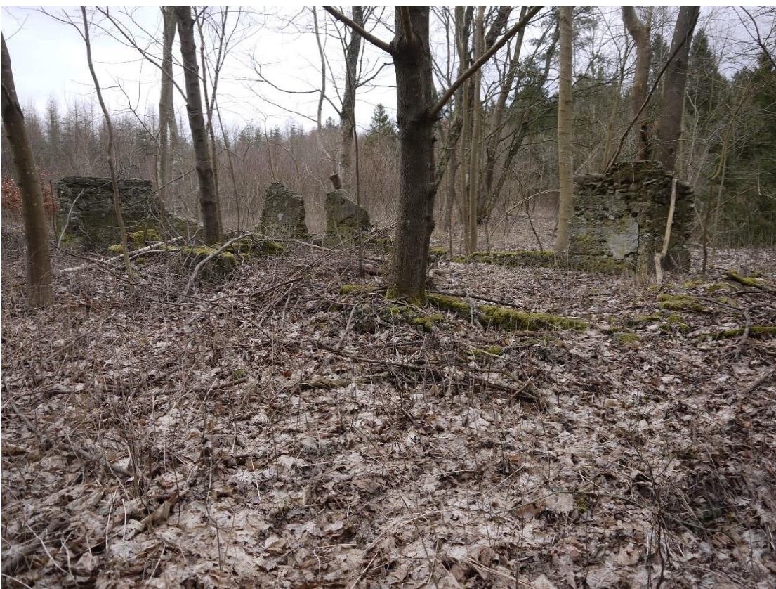
Ruinerne af Gladhuset.