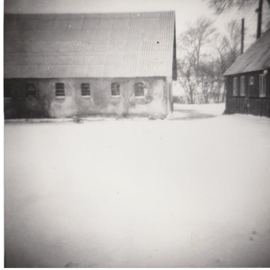
Til venstre: Sydlængen med de fire tyskerporte ca. 1965, taget i anledning af, at den store poppel foran huset lige er blevet fældet. Til højre vestlængen ca. 1965, stadigvæk med de tyske jernvinduer. Fra Jes Thomsens fotoalbum.