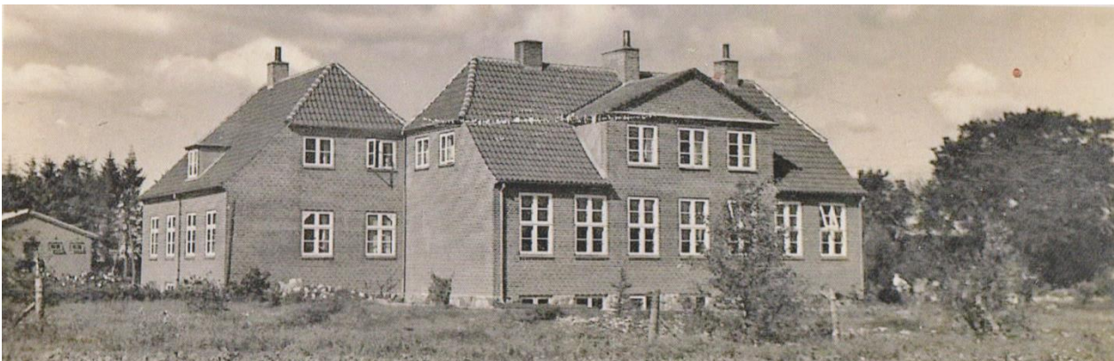
Krarup skole var opført i 1936 og var Nødager sognekommunes stolthed. Blot otte år efter opførelsen blev den beslaglagt af tyskerne med blot et døgn varsel.

Stabrand blev nu omdannet til en soldaterby for flyvepladsen. I to gårde i den østlige udkant indrettedes hhv. gendarmeri og biograf- og teatersal, i forsamlingshuset blev der køkken og kantine, i andre bygninger blev der kontor for udstedelse af "Ausweiss" med tilladelse til at færdes på flyvepladsområdet,