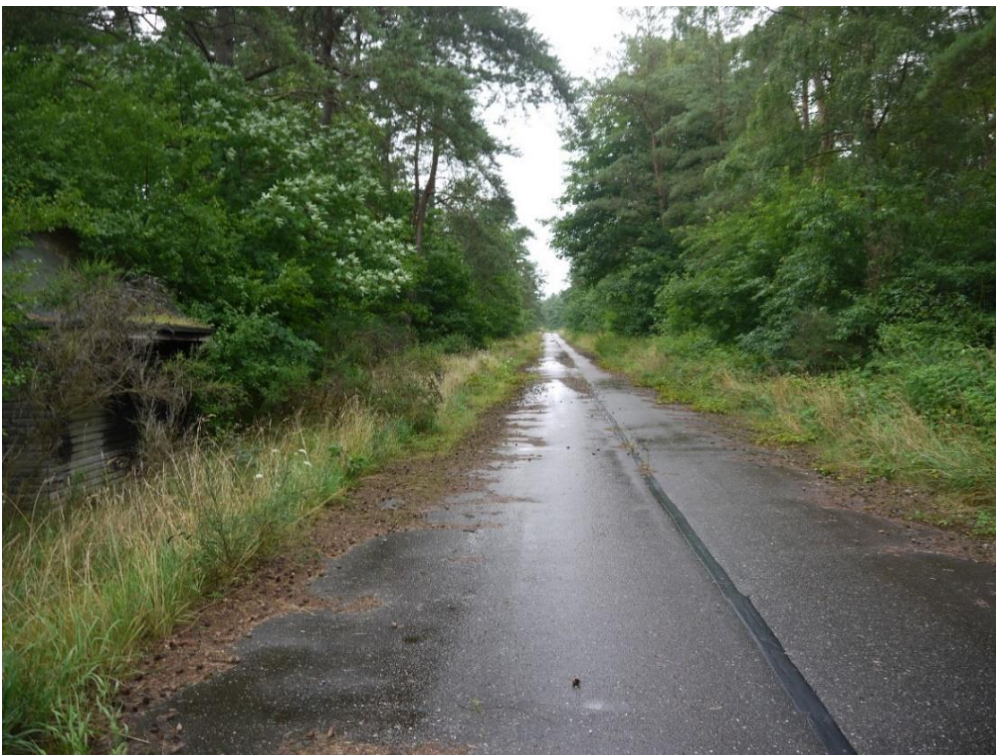
Sådan ser den gamle Feldballe – Kolind vej ud i dag, betonen fra den tyske rullebane ligger der endnu. Til venstre rester af et tysk vagthus. Lidt ude ad vejen til højre lå Grandal. Foto VFH 2020.