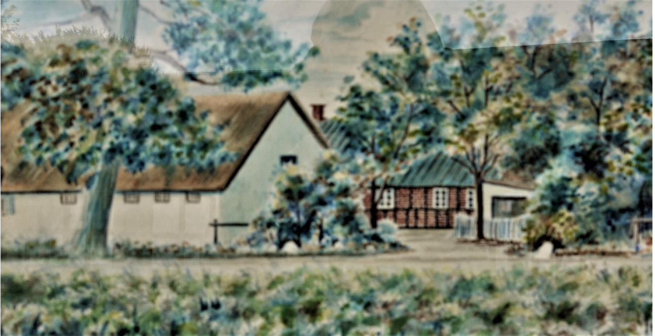
Lykkegården i 1930'erne, malet af lærer Ibsen, Krarup skole. Stuehus og udhus stort set som i dag, men sydlængen til venstre i billedet blev fuldstændig ændret af tyskerne, jf. senere foto fra nutiden.

har vel skullet gå stærkt, så man slækkede på kvaliteten. Eller også var det produceret efter tysk standard og ikke til det danske klima.