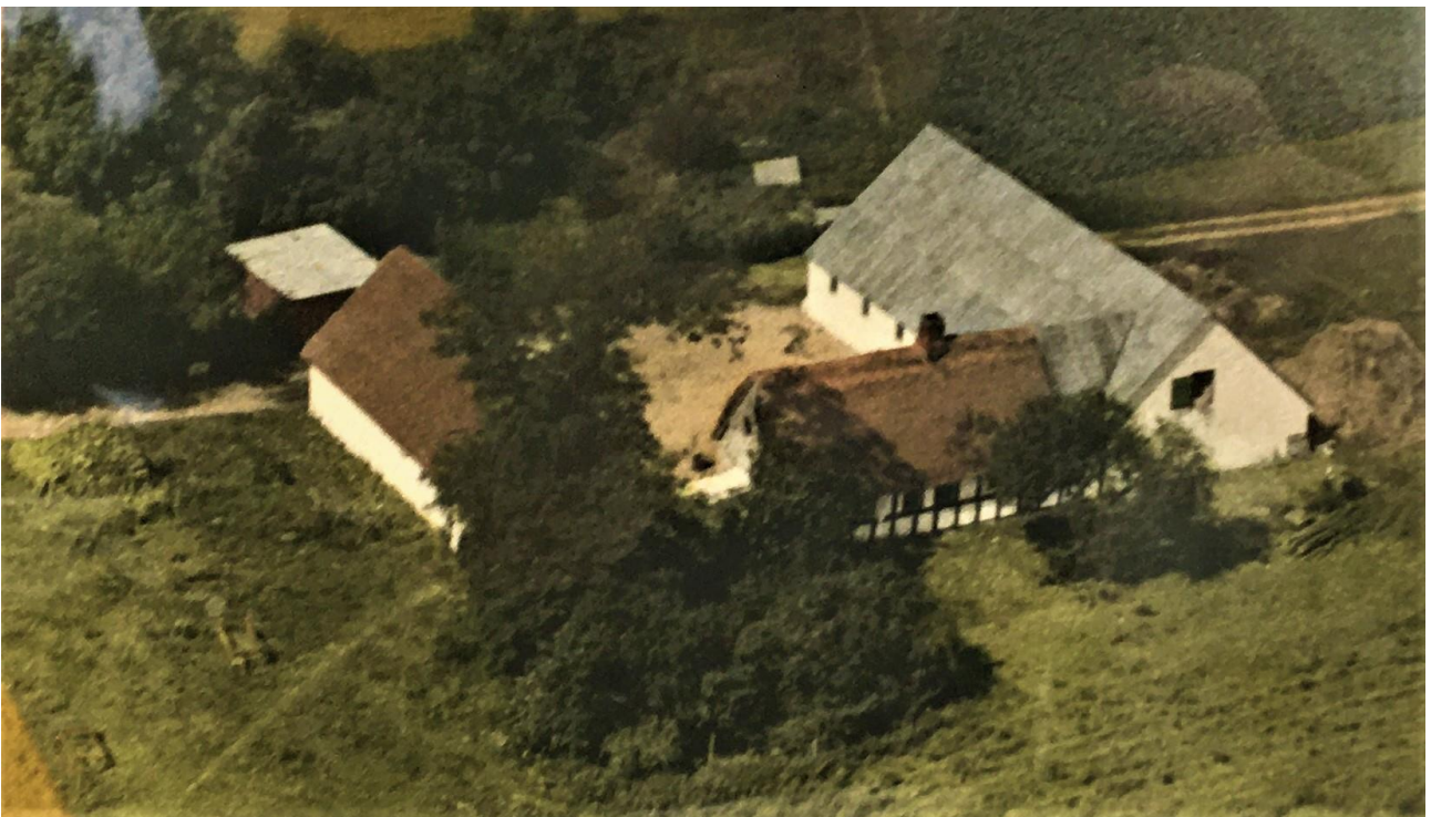
Gården på Ydesmindevej, som den så ud, da vi flyttede dertil i 1945. Luftfoto ca. 1950.