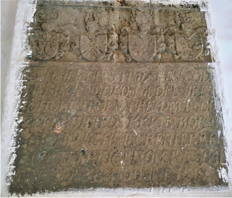
Epitafiet over Hans Skade og hustru Ingeborg Sparre på kapellets sydvæg.