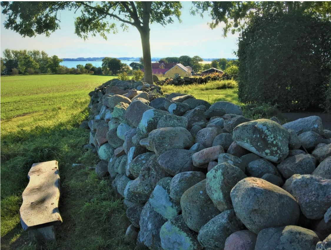
Kirke og herregård: det gamle kirkegårdsdige er bevaret, her med kik til Rolsøgård i baggrunden.

Både Rolsø og Knebel var indtil 1551 annekssogne til Tved, men netop dette år flyttede præsten til Rolsø, måske i forbindelse med at Knebel og Rolsø blev et selvstændigt pastorat? I begyndelsen af 1600-tallet ved vi dog, at præsten boede i Knebel, og at den gamle præstegård i Rolsø var blevet anneksgård til præstegården i Knebel.