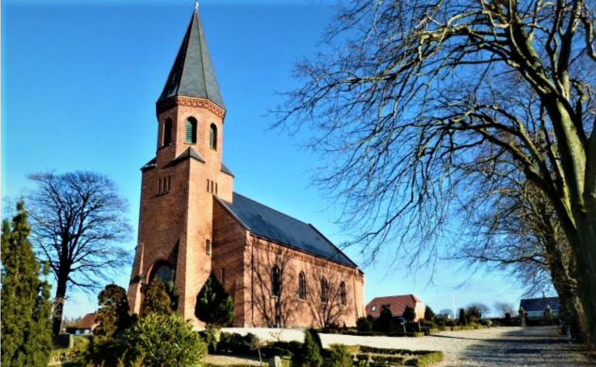
Vrinners kirke, foto VFH 2011.