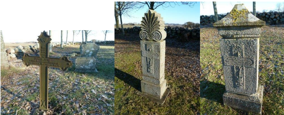
Gamle gravsteder på Rolsø kirkegård. VFH 2010.

Blandt de gravsteder, der stadigvæk passes, dominerer gravstederne for ejerne af Rolsøgård og Rolsøgårds aflæggergård, Aldershvile. Naturligt nok, for som tidligere fastslået, så hænger Rolsø kirkes og Rolsøgårds historie uløseligt sammen. Stort set finder vi alle ejere af Rolsøgård siden