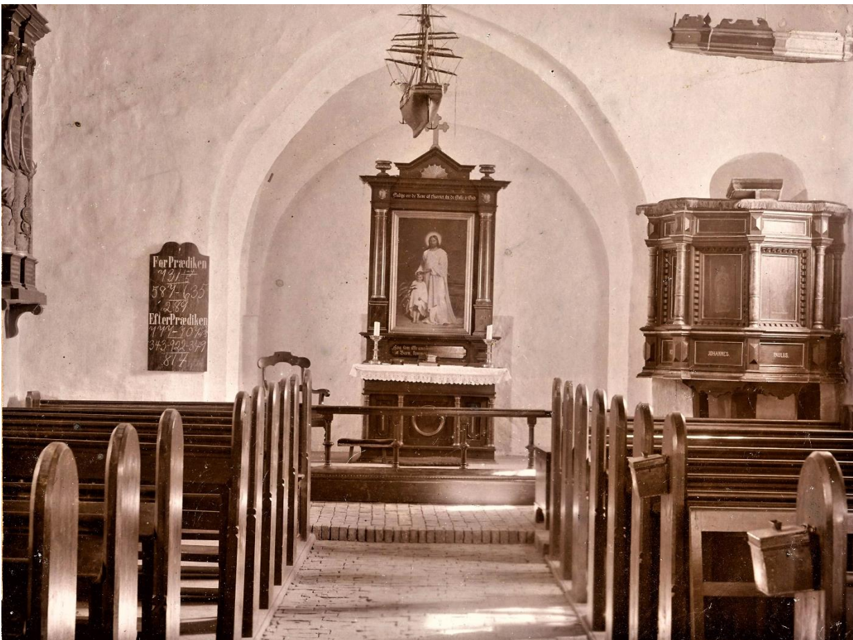
Rolsø kirkes indre omkring århundredskiftet 1900. Alter og prædikestol overførtes til den nye kirke i 1907, men alteret førtes senere tilbage til Rolsø kapel. Prædikestolen er endnu i Vrinners, men i restaureret og ændret skikkelse. Molsarkivet.

Landsbyens forsvinden og kirkens noget ensomme beliggenhed derefter gav måske heller ikke anledning til de store protester fra sognets øvrige beboere – ret beset var der jo ingen ændring i deres adgang til kirken. Afstanden var jo den samme.