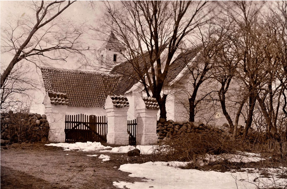
Rolsø kirke omkring århundredskiftet 1900. Portindgangen forrest samt våbenhuset står på samme sted i dag.