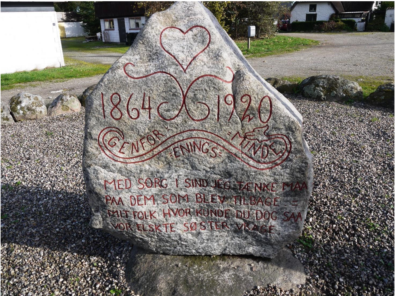
Genforeningsstenen i Stabrand.