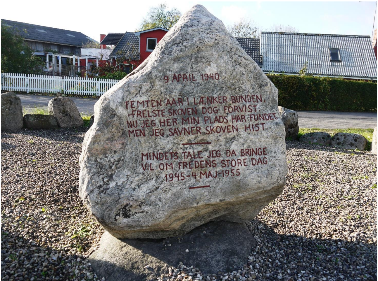
”Bagsiden” af genforeningsstenen, der minder om befrielsen 4. maj 1945 og flytningen til Stabrand by 1955. Foto VFH 2018.