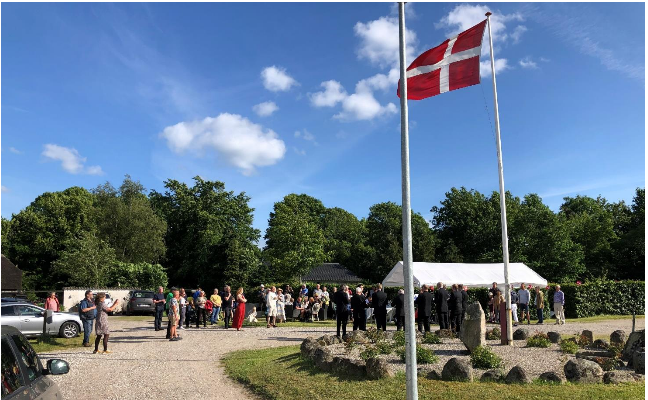
Genforeningsfesten i Stabrand 15. juni 2021. Forrest til højre anlægget med genforeningsstenen. Derefter - med ryggen til fotografen - Aarhus Studentersangere.