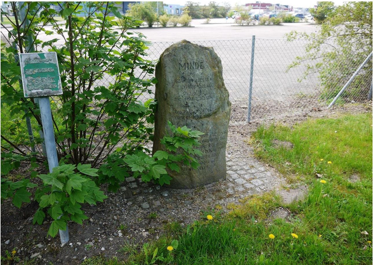
Anlægget ved lufthavnen med Jens Jessen-stenen og informationstavle.

Sådan set hører Jens Jessen-stenen jo sammen med genforeningsstenen, men de to sten må altså nu friste en tilværelse lidt på afstand fra hinanden.