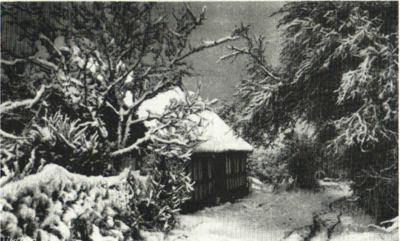
Mit barndomshjem i Rønde hvor jeg boede de første ti år af mit liv.

Da jeg kommer til enden af vejen, sætter jeg ubesværet af fra kanten og svæver hen over dalen. Jeg kan se floden bugte sig under mig lige så langt som øjet rækker. Jeg lander ved bredden af floden, og det bliver betydet mig, at jeg skal drikke vand fra floden. Og så husker jeg ikke mere før jeg ser det hvide lys. Og hører de høje stemmer. Denne ”erindring” har altid fulgt mig. Jeg kan ikke huske om jeg nogen sinde har drømt det. Jeg ved bare, at jeg altid har vidst det.