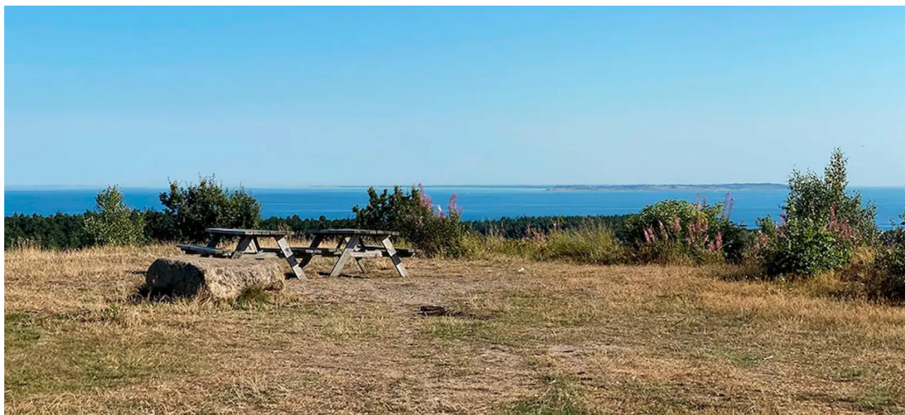
Ellemandsbjerg med den betagende udsigt.

Ellemandsbjerg er i dag bar, men omgivet af nåleskov. Forklaringen er, at "bjerg" lige som det øvrige Mols og Helgenæs har ligget bar, med lyng og hede, til op i slutningen af 1800-tallet og begyndelsen af 1900-tallet, hvor plantningssagen med Dalgas i spidsen gjorde sig gældende, og en stor del af Mols og Helgenæs blev tilplantet med granskov. Men i slutningen af 1900-tallet og begyndelsen af dette århundrede blev en stor del af granskovene, især på de højeste punkter, fældet, af hensyn til biodiversiteten og rekreative formål, herunder udsigten. På Ellemandsbjerg betød det, at den vide udsigt igen kunne nydes i fulde drag.